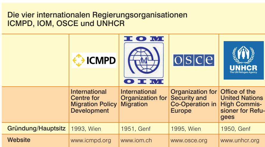
Tab. 2: Die vier internationalen Regierungsorganisationen ICMPD, IOM, OSCE und UNHCR

Werden im ersten Zitat die Nicht-EU-Staaten zu einer engen Präventions-„partnerschaft“ verpflichtet, deutet sich im zweiten Zitat der Nutzen an, den sich die EU von der Inanspruchnahme internationaler Organisationen verspricht. Mittels einer textanalytischen Auswertung relevanter EU-Dokumente lässt sich die Bedeutung bzw. Abhängigkeit der EU von diesen Organisationen klar herausarbeiten: IOM und andere Nicht-EU-Akteure sollen im Auftrag der EU in den migrationspolitischen Außenbeziehungen aktiv werden; der ihnen zugewiesene Handlungsort liegt dabei ausschließlich in den Nicht-EU-Staaten (dazu ausführlich: GEIGER 2011, S. 142-150). Hieraus folgt: Die EU-Migrationspolitik erfährt eine entscheidende Erweiterung mittels der Fusion von EU-Steuerungsvorstellun-