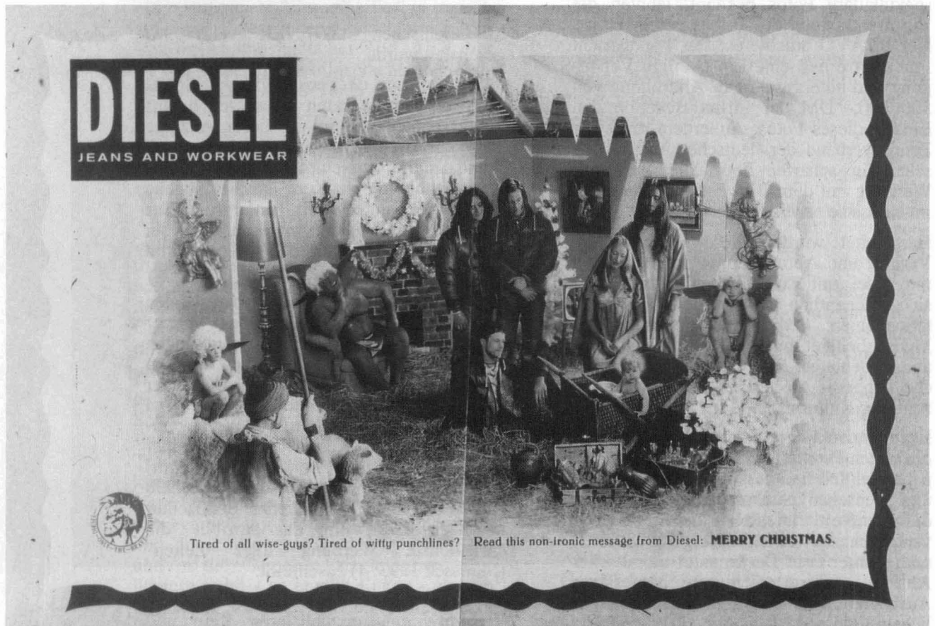
BILD skandalisierte umgehend: dreispaltig wurde das anstößige Foto auf der ersten Seite abgebildet (mit einem Aufschrei der

dung aus dem Hause Kern, sondern ebenso für die Akzeptierung Andersdenkender und -lebender, für den 'pfléglichen' Umgang mit anderen Menschen, Rassen und der Natur und für vieles andere moralisch Korrekte.