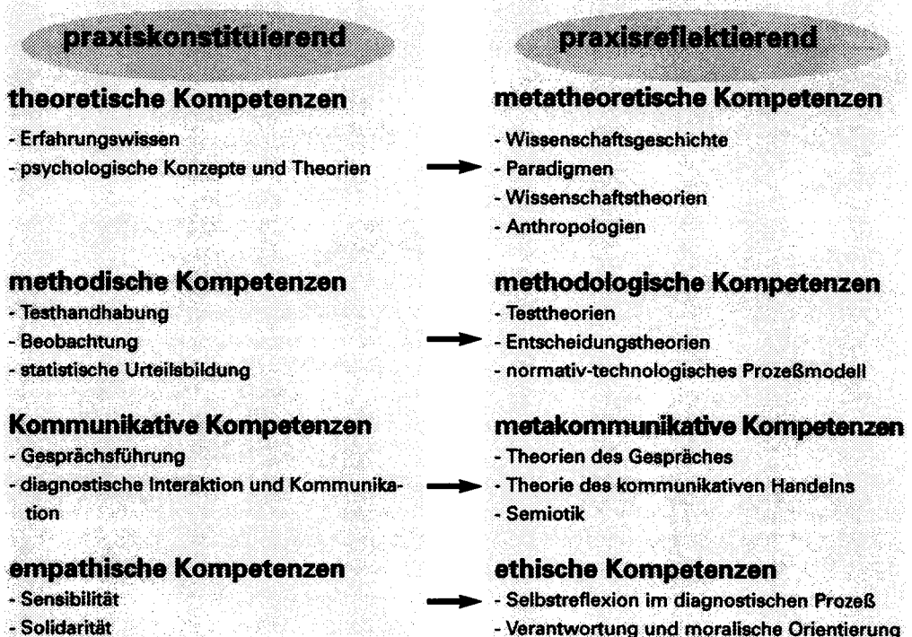
Abb. 1 Psychodiagnostische Grundkompetenzen im psychosozialen Modell

munikativen Konzeption wird das diagnostische Handeln in erster Linie von solchen Kompetenzen getragen, die psychodiagnostische Praxis überhaupt erst ermöglichen. Im Anschluß an die Überlegungen zu menschlichem Expertentum nenne ich sie praxisbegleitende oder praxiskonstituierende Kompetenzen. Sie befähigen unmittelbar zum diagnostischen Handeln. Sie stehen eher für ein Können, denn für ein Wissen im Sinne eines vollständig explizierbaren Regelkanons. Im Anschluß an andere Terminologien können wir diese Basiskompetenzen auch knowing how (Ryle 1949) oder implizites Wissen (Polanyi 1985) nennen. Das gesamte Spektrum der praxisbegleitenden Kompetenzen unterteile ich in vier Teilbereiche, nämlich in theoretische, methodische, kommunikative und empathische Kompetenzen (vgl. Abb. 1). Diesen Kompetenzbereichen sind jeweils praxisreflektierende, nämlich metatheoretische, methodologische, metakommunikative und ethische Kompetenzen zugeordnet.