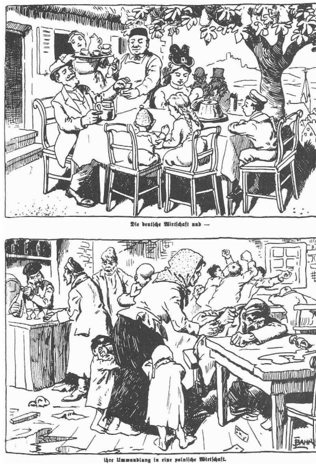
Abb. 6: Deutsche und polnische Wirtschaft als Kontrast, in: Kladderadatsch, Nr. 30/1919

Quelle: Kladderadatsch, Nr. 30/1919, entnommen aus HOFFMANN (1997), Abb. 6.