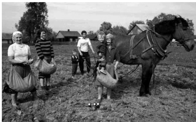
Abb. 6. Foto in „Der Spiegel“ anlässlich der bevorstehenden EU-Beitritte (2002)

Quelle: DER SPIEGEL (2002): Die Alte Welt erschafft sich neu, in: Der Spiegel Nr. 50/2002, 09.12.2002, S. 56.