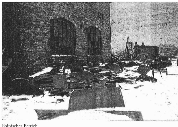
Abb. 3. Foto des Gaupresseamtes Wartheland in Posen (1940)