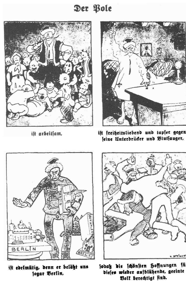
Abb. 5.: Der verspottete Pole, in: Kladderadatsch, Nr. 5/1919