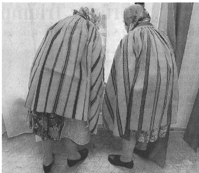
Abb. 7. Foto in der „Berliner Zeitung“ anlässlich der Europawahlen (2009)