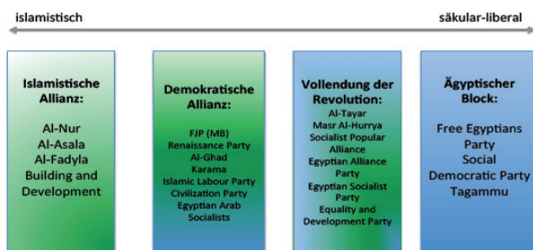
Abbildung 2: Parteienbündnisse

Partei. Obwohl sich hier eine gewisse Polarisierung zwischen islamistischen und dezidiert nicht-islamistischen Kräften abzeichnet, haben sich in der Mitte zwei Bündnisse aufgetan, in denen Islamisten, Liberale und Linke kooperierten: die „Demokratische Allianz“ und die „Vollendung der Revolution“. Unabhängig vom politischen Lager wollen die in diesen Bündnissen vertretenen Parteien eine zunehmende Polarisierung der Gesellschaft in islamistisch versus nichtislamistisch vermeiden. Stärkste Kraft in der „Demokratischen Allianz“ bildet die FJP der Muslimbruderschaft. Aber auch die liberale Ghad Partei ist in ihr vertreten. Zum Bündnis „Vollendung der Revolution“ gehört neben Linken und Liberalen auch die al-Tayar Partei – eine Abspaltung der Muslimbruderschaft, gegründet von Jugendlichen der Organisation.