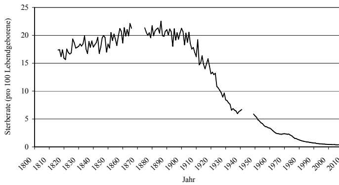
Schaubild 1: Die Entwicklung der Säuglingssterblichkeit in Deutschland, 1875-2007