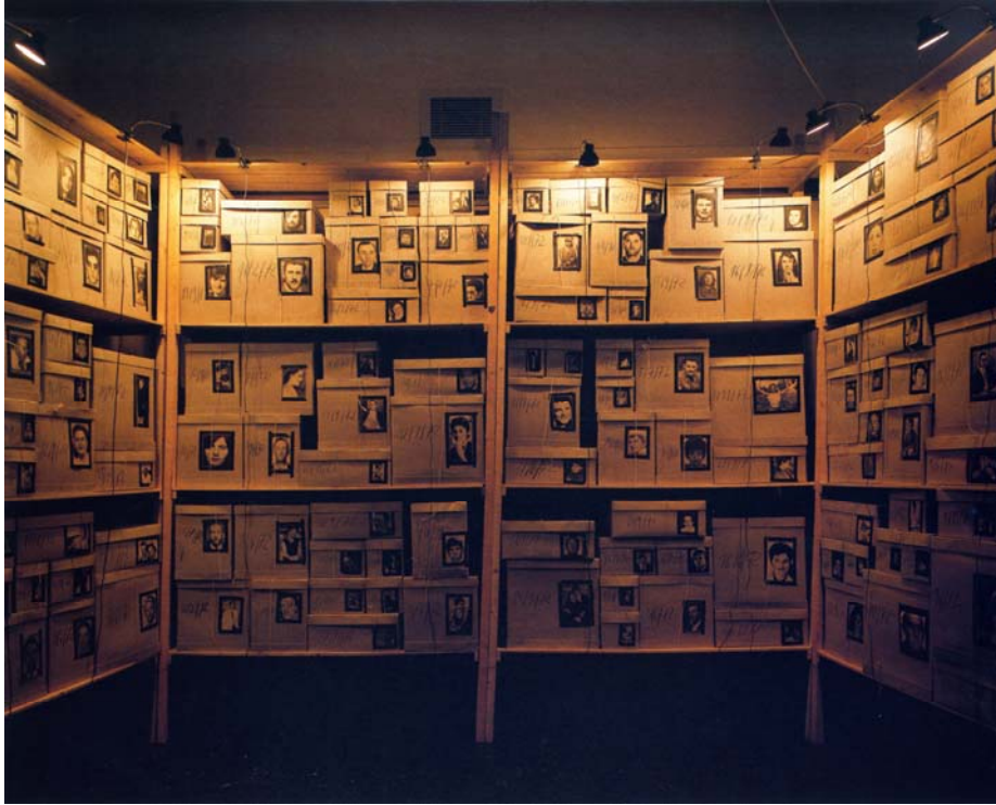
Abbildung 7: “Réserve: Détective”, 1988, Installation view, “Inventar”, Kunsthalle Hamburg, 1991’ (Flammarion, p. 129)

Eine Vorstufe des Archivs sind Dachkammern und Kellerräume. In diesen dezentralen Depots herrscht in der Regel allerdings keine bewusste Auswahl und Ordnung, vielmehr handelt es sich um Sedimentierungen dessen, was der Aufmerksamkeit entzogen und in Vergessenheit geraten ist. Weitere Stationen des sozialen und kulturellen Vergessens sind der Flohmarkt und der Müll. Rückstände von Wohnungsaufösungen und Nachlässen, um die sich niemand kümmert, werden entweder entsorgt und spurlos vernichtet oder landen im Trödel, wo Boltanski einige seiner Fotoalben erworben hat. Dort werden dann die materiellen Rückstände eines aufgelösten Familiengedächtnisses in alle Winde zerstreut und gehen möglicherweise in neue Sammlungen ein, aus denen sie unter Umständen auch den Weg ins Archiv finden können. Das kulturelle Gedächtnis umfasst also Formen und Praktiken des Entsorgens und Vergessens ebenso wie Institutionen des Speicherns und Erinnerns. Entscheidend bleibt dabei jedoch die grundsätzliche Möglichkeit, dass Verlorenes und Vergessenes, sofern es nicht materiell zerstört ist, noch einmal ins kulturelle Gedächtnis zurückgeholt werden kann.