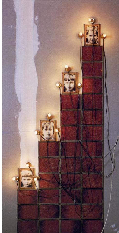
Abbildung 4: Monuments (1): “The Children of Dijon”, from ‘Inventory’ 1991, black and white and colour photographs, tin boxes, light bulbs, wire. Photographs: 20.5x15cm each. Installation, Vancouver Art Gallery, 1989’ (Phaidon, p. 95)