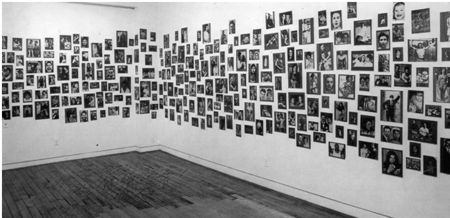
Abbildung 1: Images d'une année de faits divers. Sonnabend Gallery, New York (1973), 'Installation view, Sonnabend Gallery, New York, 1973' (Flammarion, p. 41)

stellungen überwältigt, sondern gerade auch die Rahmenlosigkeit der Bilder. Ohne eine spezifizierende Referenz, d.h. die Rahmung durch Namen, Zahlen, Erzählungen und andere Informationen, werden diese exakten Fotos bedeutungslos.