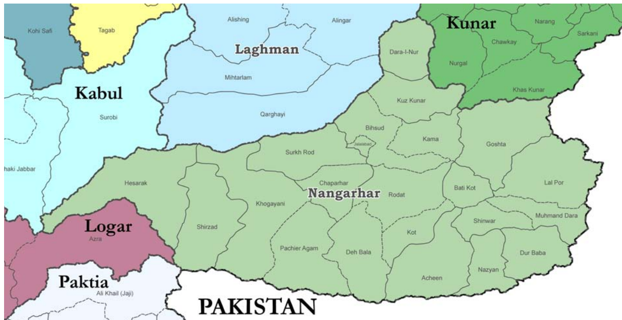
Abb. 2: Provinz Nangarhar mit Distrikten 53

Die Provinz Nangarhar liegt im Osten Afghanistans. Sie ist in 22 Distrikte aufgeteilt und mit einer Gesamtfläche von 7'616 km 2 etwas größer als der Kanton Graubünden (7'105 km 2 ). Nach offiziellen Angaben zählt die Provinz rund 1'360'000 Einwohner. 54 Der Hauptort Jalalabad ist mit schätzungsweise über 200'000 Einwohnern die fünftgrößte Stadt in Afghanistan. Sie liegt in einer breiten, fruchtbaren Ebene, wo die Flüsse Laghman, Surkh Ab und Kunar in den Kabul fließen. 55