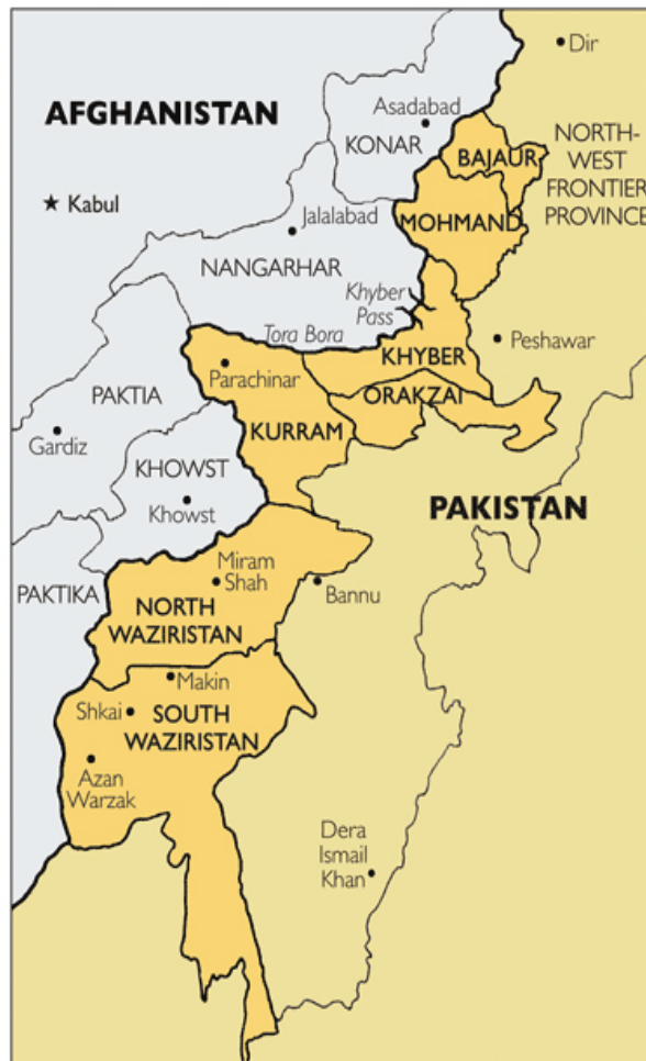
Abb. 4: Karte der FATA 81