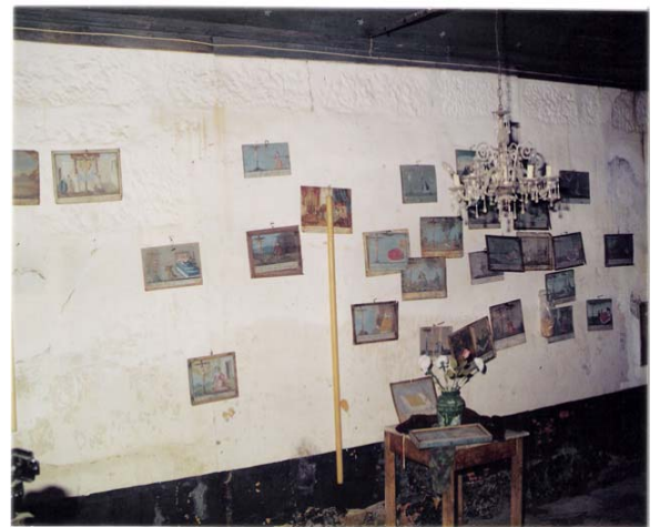
Em baixo: interior da capelinha do Senhor Jesus do Calvário, com as tábuas votivas e outros ex-votos, (1993).