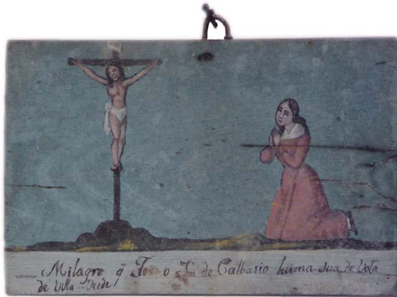
Tábua votiva n.º 44 « Millagre que Fes o Senhor do Calvario humma sua de Vota de Villa Verde»