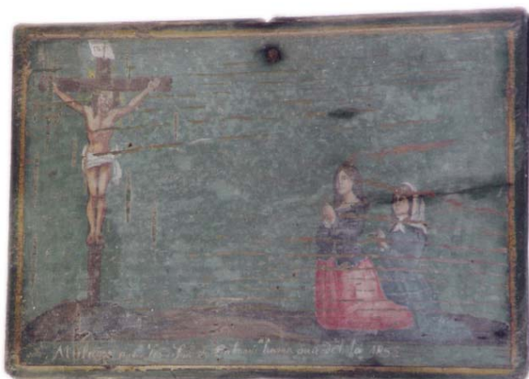
Tábua votiva n.º 8 «Millagre que Fes o Senhor do Calvario Cuurar ou ã debota 1855»