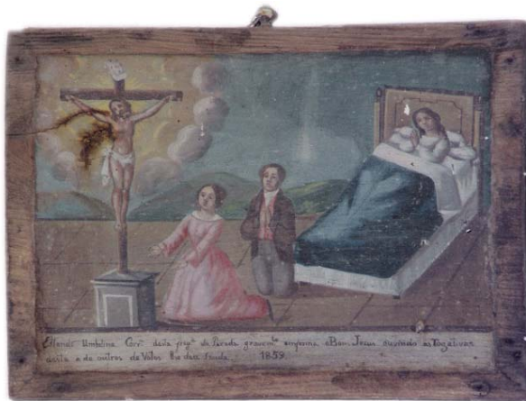
Tábua votiva n.º 14 «Estando Umbelina Correia desta freguesia gravemente enferma o Bom Jezus ouvindo as rogativas desta e de outros de Votos lhe deu saude 1859»