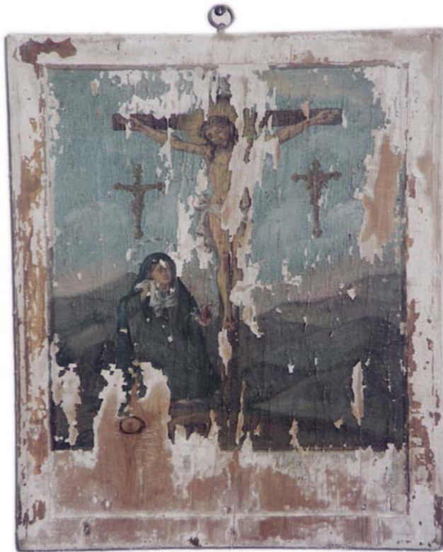
À esquerda: Tábua votiva n.º 51 Em estado mau estado de conservação.