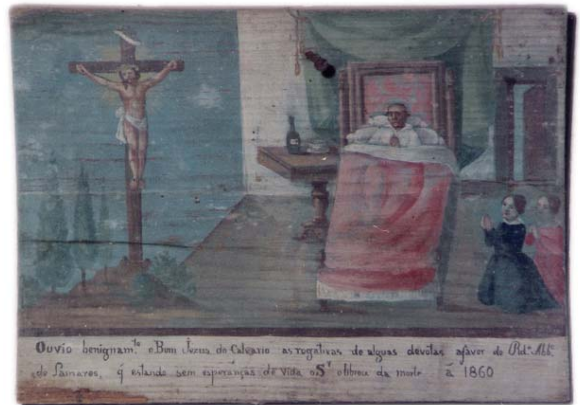
Tábua votiva n.º 17 «Ouvio benignamente o Bom Jezus do Calvario as rogativas de algumas devotas a favor do Reverendo Abade de Lamares que estando sem esperanças de vida o Senhor o librou da morte anno 1860»