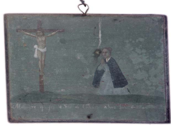
Tábua votiva n.º 46 « Millagre que fes o Senhor do Calvario a hua devota »