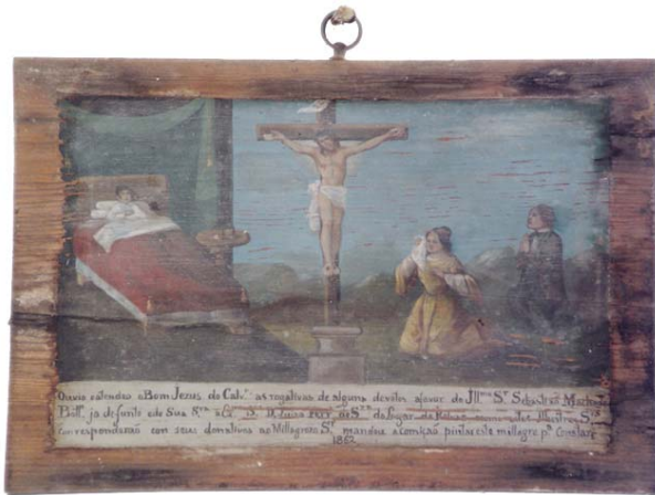
Tábua votiva n.º 26 «Ouvio e atendeo o Bom Jezus do Calvário as rogativas de alguns devotos a favor do Illustrissimo Senhor Sebastião Machado Botelho ja defunto e de sua Senhora a Excelentissima Senhora D. Luiza de Souza do Lugar de Relvas e como estes Illustres Senhores con responderão com seus donativos ao Millagrozo Senhor mandou a comição pintar este millagre para constar 1862»