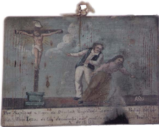
Tábua votiva n.º 2 «Por suplicas e rogos de Deroteia Engeitada de Parada de Pinhão foi servido o Bom Iezu do Calvario depararlhe o dinheiro perdido [...] aos tratos no Anno de 1852»