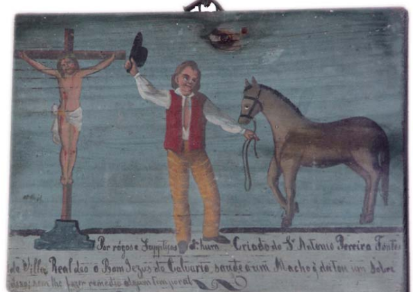
Tábua votiva n.º 42 « Por rógos e Supplicas d' hum Criado do S. Antonio Ferreira Fontes de Villa Real deo o Bom Jezus do Calvario saude a um Macho q' deitou um sobressos; sem lhe fazer remedio algum temporal »