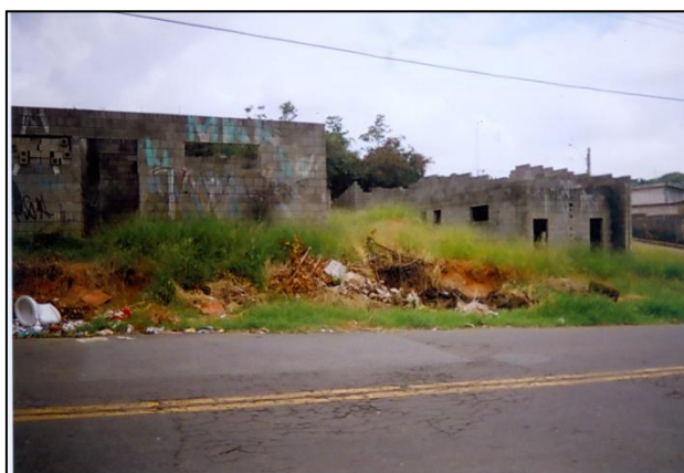
FIGURA 7 – Construção abandonada no bairro.

Podemos concluir observando que aos poucos elas foram conquistando o saber fotográfico, desenvolvendo um olhar mais atento para captar as imagens, além de aprender a conhecer e reconhecer a sua Vila, através de um outro olhar mais detalhista e crítico. Durante este processo de percorrer as ruas do bairro, elas também foram fazendo questionamentos sobre sua vida, sobre o processo de envelhecimento, bem como enfocando as questões sócio-culturais que a comunidade enfrenta.