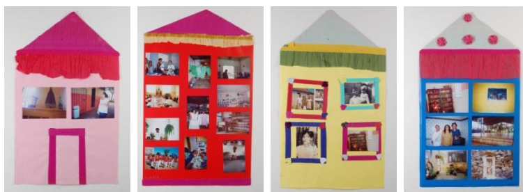
FIGURA 8 – Painéis da exposição confeccionados pelas participantes 8

Desde o início da proposta da oficina já havia sido discutido com as idosas que o círculo de produção imagética só se fecharia com a devolução dos resultados através de uma exposição a ser realizada em local por elas escolhido.