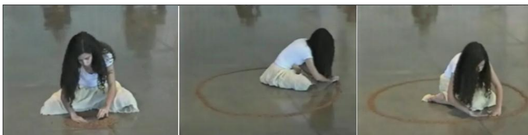
FIGURA 2 – Performance Andu 9