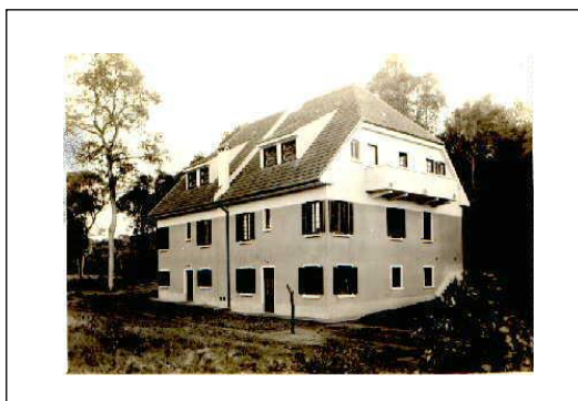
FIGURA 1 – Casa construída 1936 em São Leopoldo/RS 8