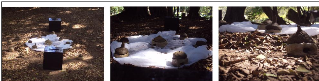
FIGURA 4 – Ouvindo o Mundo 2010