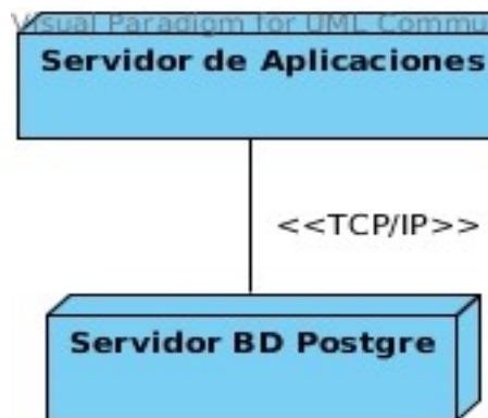
Figura 7: Diagrama de despliegue