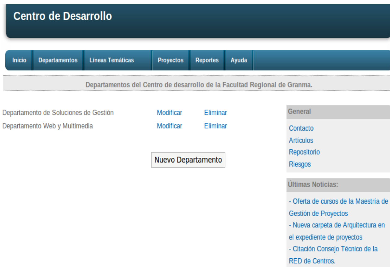
Figura 4: Adicionar un nuevo departamento

Solo se hace muestra la interfaz de usuario del escenario “Adicionar un nuevo departamento”.