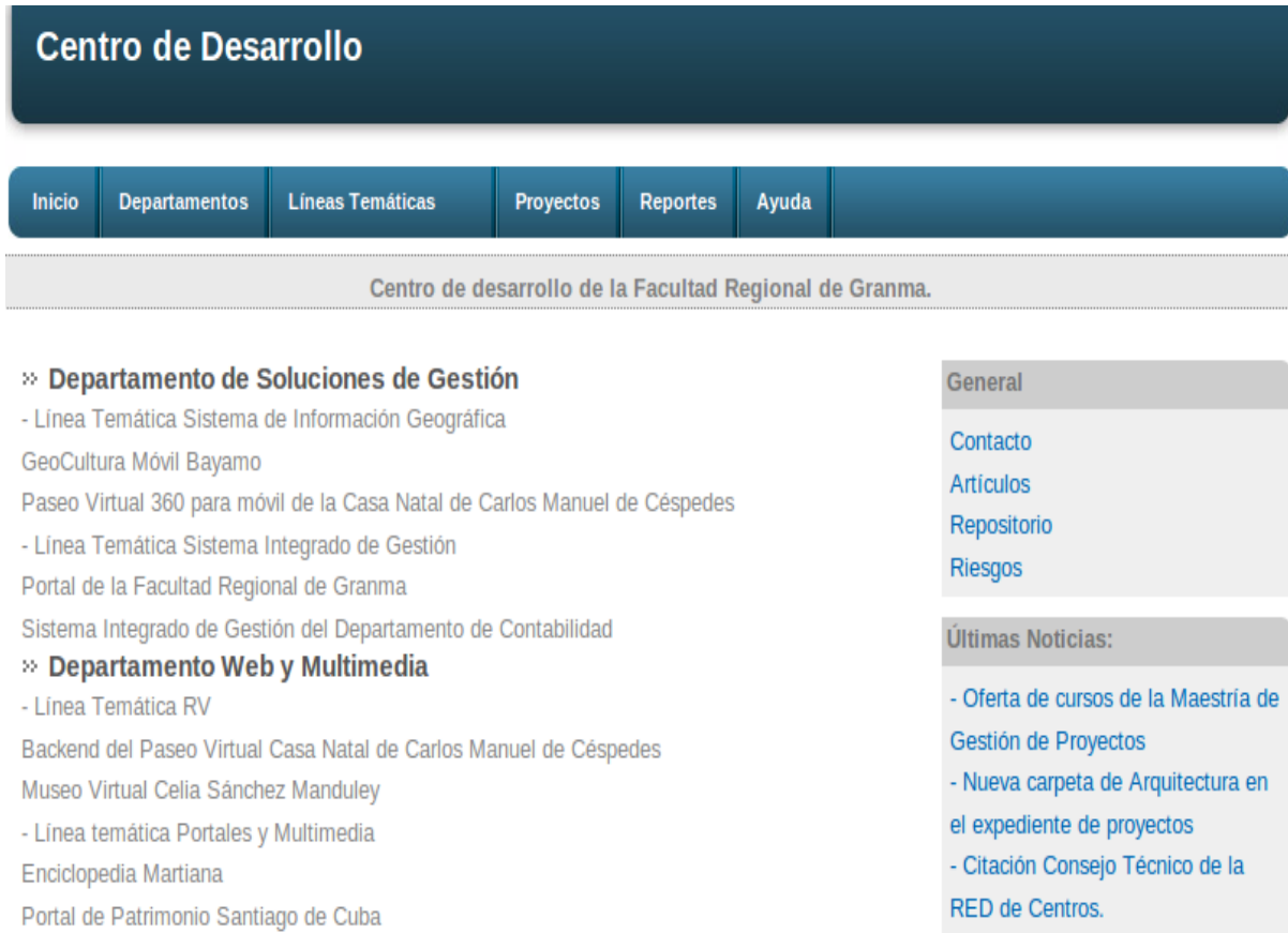
Figura 3: Portada de la aplicación

de Granma y otros enlaces de interés para dicho centro.