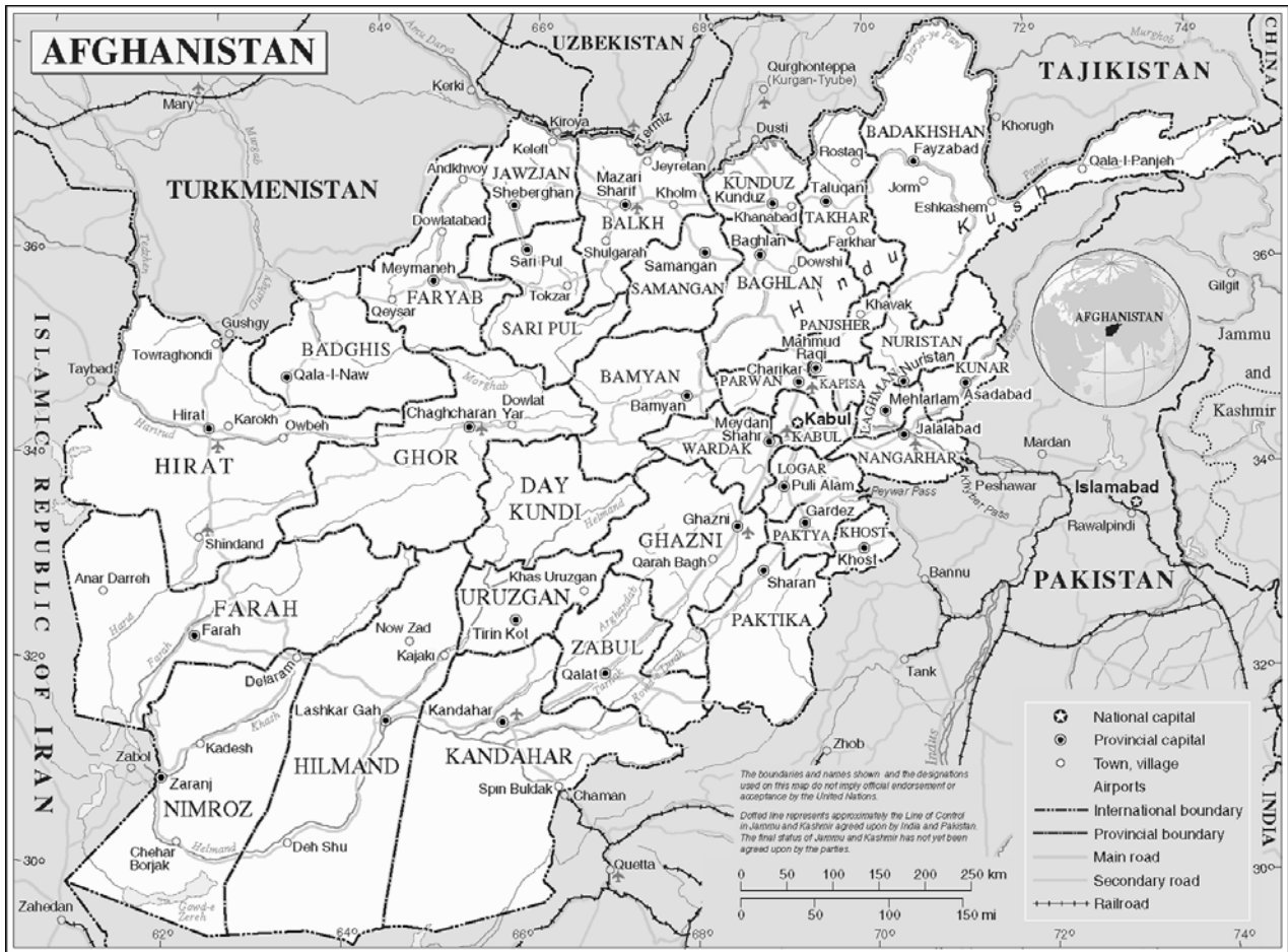
Afghanistan: Provinzen und regionales Umfeld