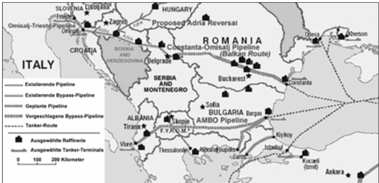
Projekte für Erdölpipelines auf dem Balkan