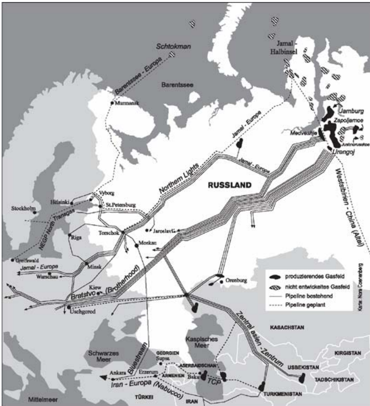
Karte 1 Erdgasleitungen nach Westeuropa