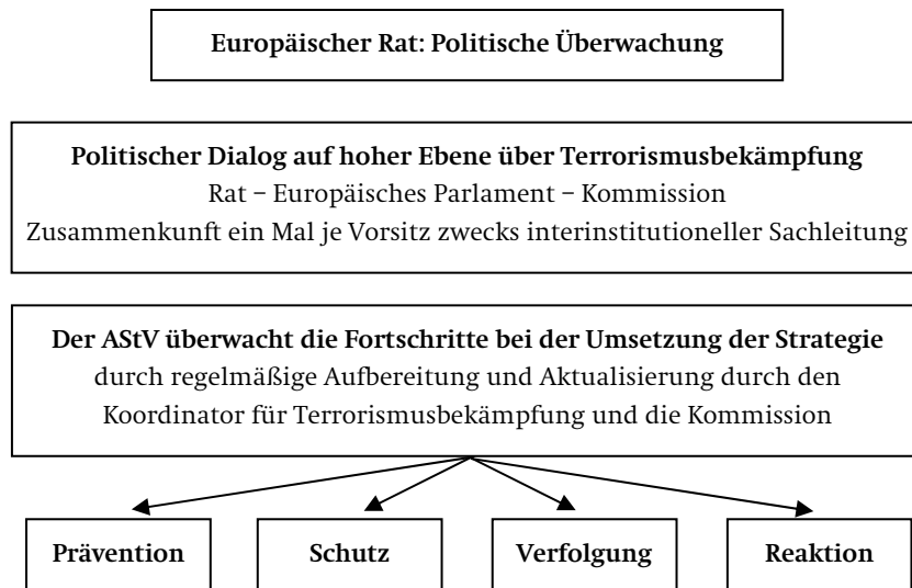
Graphik 3 Aufgaben zentraler EU-Institutionen bei der Terrorismusbekämpfung

einen nachhaltigen Effekt haben, wenn sie von ernsthaften institutionellen Reformen begleitet wird. Ihr Erfolg hängt zuallererst davon ab, ob die Mitgliedstaaten sich darauf einigen, welche politischen Ziele – jenseits der zentralen Handlungsprioritäten einzelner Arbeitsfelder – über die EU bei der Terrorismusbekämpfung erreicht werden sollen. Fehlt dieses Verständnis, besteht die Gefahr, dass sich die EU-Politik in der Terrorabwehr zunehmend sektoral und institutionell fragmentiert und die Mitgliedstaaten die Rolle der EU auf eine Quasi-Alibifunktion reduzieren. Bei der horizontalen Strategieplanung bietet sich daher an, dass die Teamratspräsidentschaft ihre Bemühungen auf das Arbeitsfeld Prävention konzentriert: