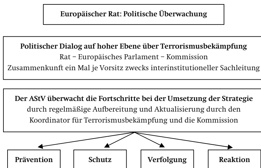
Graphik 3 Aufgaben zentraler EU-Institutionen bei der Terrorismusbekämpfung

einen nachhaltigen Effekt haben, wenn sie von ernsthaften institutionellen Reformen begleitet wird. Ihr Erfolg hängt zuallererst davon ab, ob die Mitgliedstaaten sich darauf einigen, welche politischen Ziele – jenseits der zentralen Handlungsprioritäten einzelner Arbeitsfelder – über die EU bei der Terrorismusbekämpfung erreicht werden sollen. Fehlt dieses Verständnis, besteht die Gefahr, dass sich die EU-Politik in der Terrorabwehr zunehmend sektoral und institutionell fragmentiert und die Mitgliedstaaten die Rolle der EU auf eine Quasi-Alibifunktion reduzieren. Bei der horizontalen Strategieplanung bietet sich daher an, dass die Teamratspräsidentschaft ihre Bemühungen auf das Arbeitsfeld Prävention konzentriert: