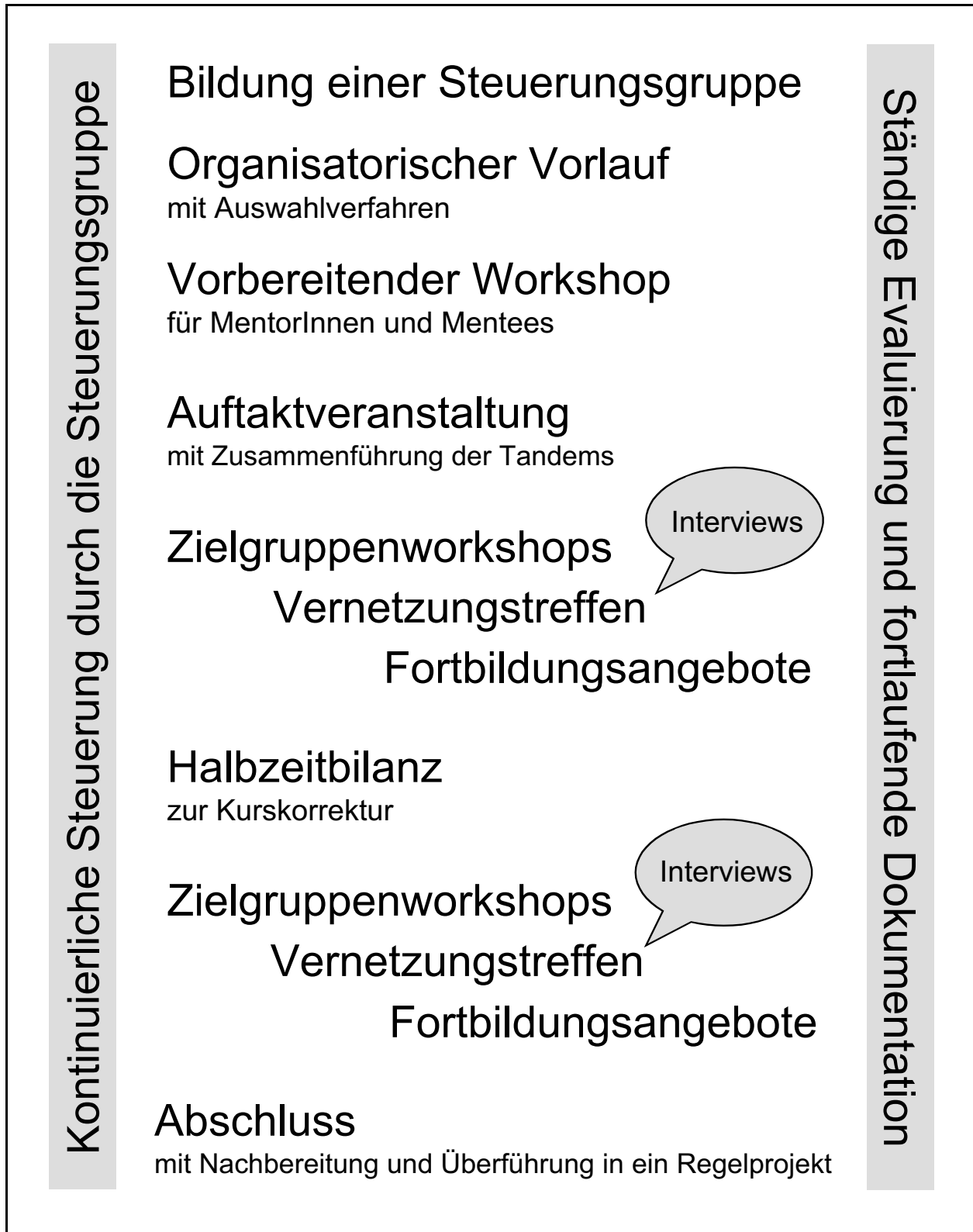
Abbildung 3: Modell für den Ablauf eines Mentoring-Programms