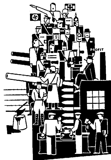
Gerd Arntz, „Das Dritte Reich“ (1934)