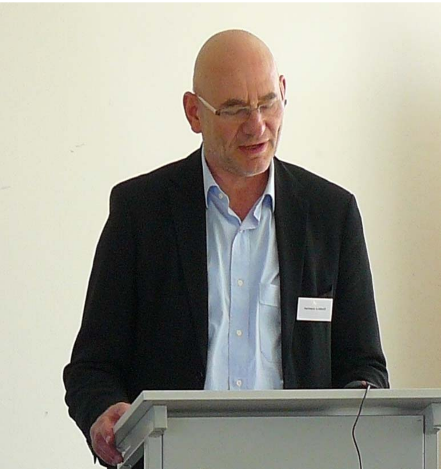
Hermann Kotthoff Arbeitsqualität im Rahmen der Europäischen Sozialpolitik: Die Rolle der Europäischen Betriebsräte