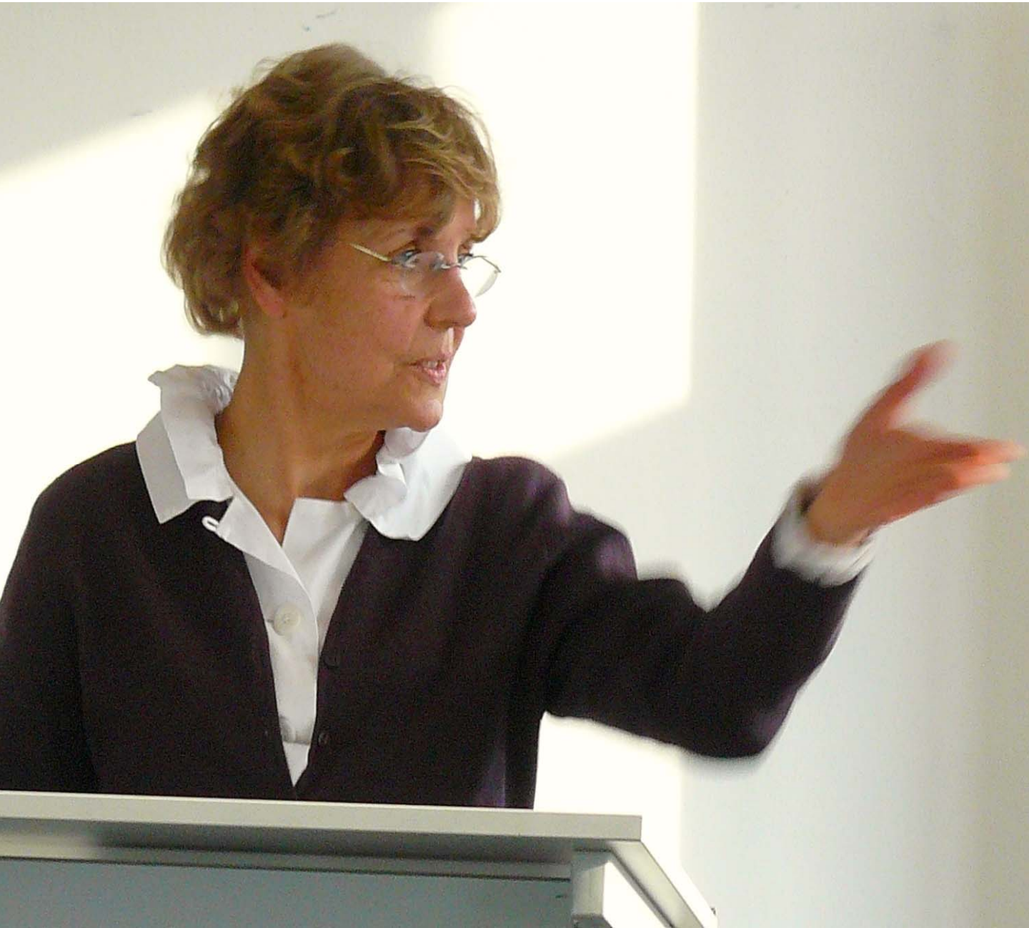
Eva Senghaas-Knobloch „Decent Work“ – eine weltweite Agenda für Forschung und Politik