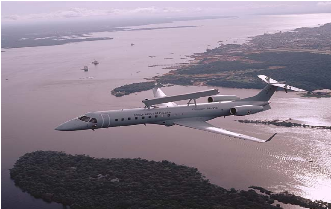
Abbildung II: Der EMB 145 AEW&C 116

Für das SIVAM-System wurden zwischen Mai 2002 und März 2003 fünf Exemplare dieses Flugzeugtyps erworben. 117 Der EMB 145 AEW&C, bei der brasilianischen Luftwaffe ist seine Bezeichnung R-99A, kann in Echtzeit Informationen über Flugbewegungen in Höhen unter 10.000 Fuß Flughöhe liefern, da das verwendete Radar speziell dafür modifiziert und angepasst wurde. Sein Einsatzgebiet ist hauptsächlich die Überwachung des Flugraums. Er wird aber auch bei der Grenzkontrolle eingesetzt und erfüllt Unterstützungs- und Koordinierungsaufgaben bei Such- und Rettungseinsätzen. Zudem eignet sich der EMB 145 AEW&C in Command&Control-Einsätzen und für Spionageaufgaben.