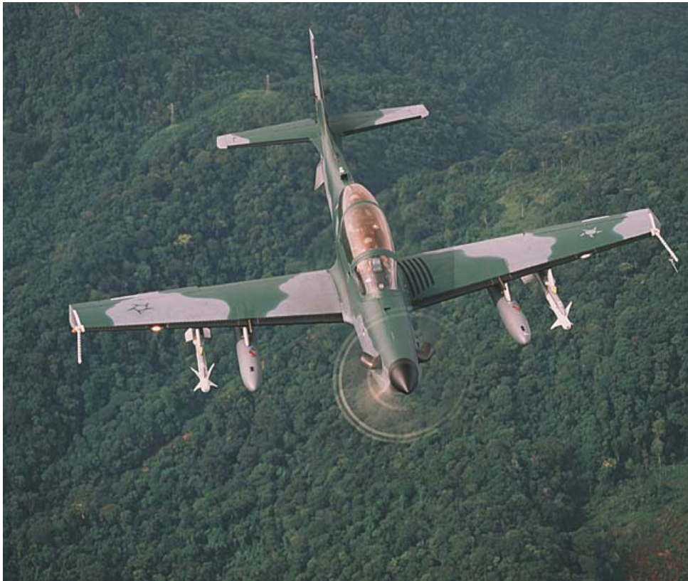
Abbildung III: Der EMB-314 Super Tucano/ALX 132

Luftraumverteidigung mehr Durchschlagskraft verleihen soll. Am 07.08.2001 beschloss die brasilianische Luftwaffe (Força Aerea Brasileira – FAB) den Kauf von 76 EMB-314 Super Tucanos/ALX, der im Militärjargon A-29 heißt und im Folgenden nur Super Tucano genannt wird. Es gibt den Super Tucano als Einsitzer- (A-29) – davon hat die FAB 25 bestellt – und als Zweisitzermaschine (AT-29) – davon sind 51 Stück geordert worden. Die Auslieferung Super Tucanos begann 2003. 131