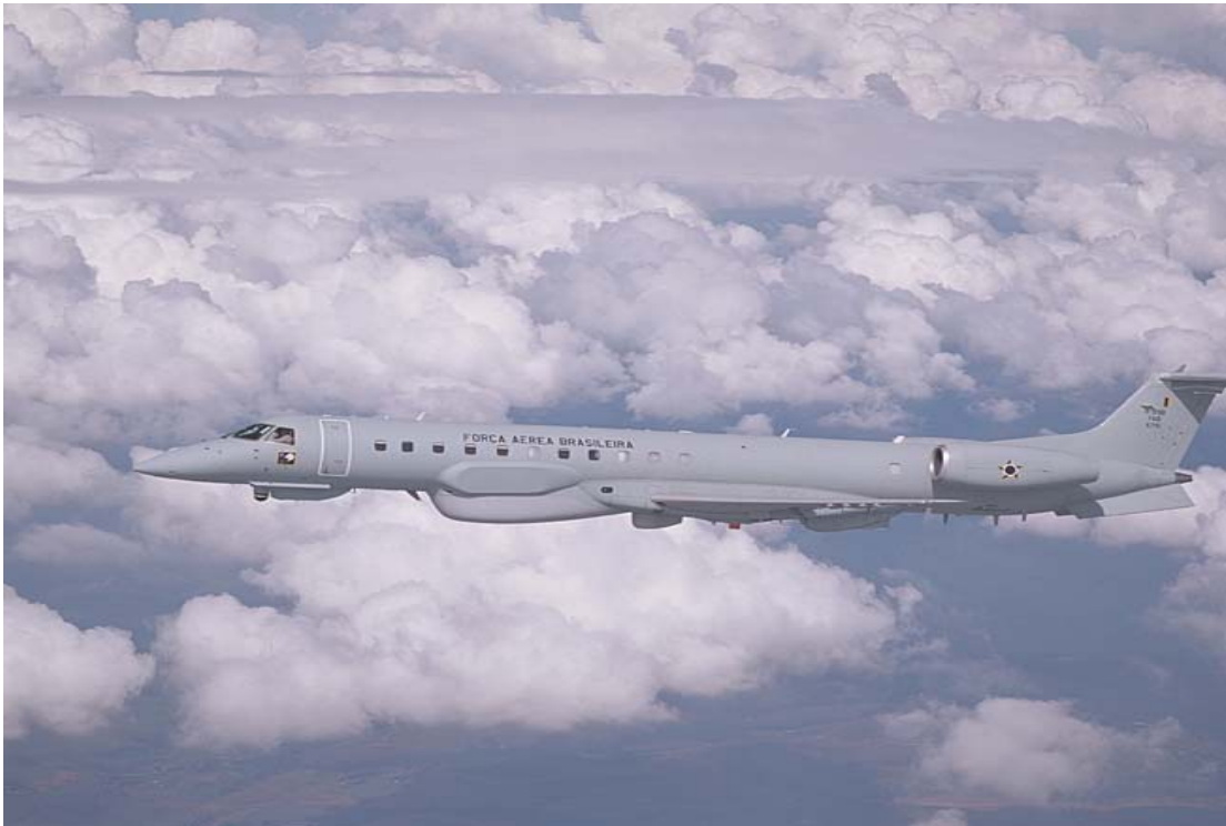
Abbildung III: Der EMB 145 RS/AGS 125

Im Gegensatz zum EMB 145 AEW&C ist der EMB 145 RS/AGS ein speziell für die Amazonasregion entwickelter „Umweltpolizist“. Der EMB 145 RS/AGS, bei der Luftwaffe R-99B, observiert große Bodenareale bei Tag und Nacht, widrigen Wetterverhältnissen oder schwierigen Oberflächenstrukturen. Somit ist der EMB 145 RS/AGS für die Daten- und Informationssammlung über das „Bodengeschehen“ zuständig, denn das Sensorensystem erkennt Bewegungen, Unregelmäßigkeiten und Veränderungen und ermöglicht das Aufspüren illegaler Holzeinschlagszonen im dichten Wald, illegalen Bergbau oder illegale Bewirtschaftung in geschützten Gebieten oder Indianerreservaten.