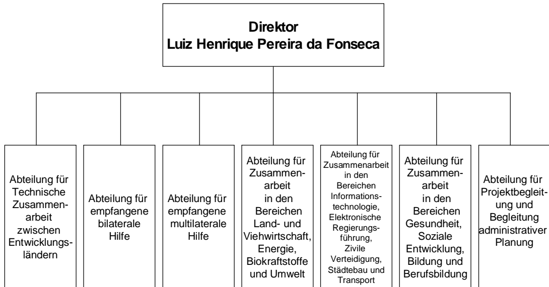
Abbildung 1: Organigramm der ABC