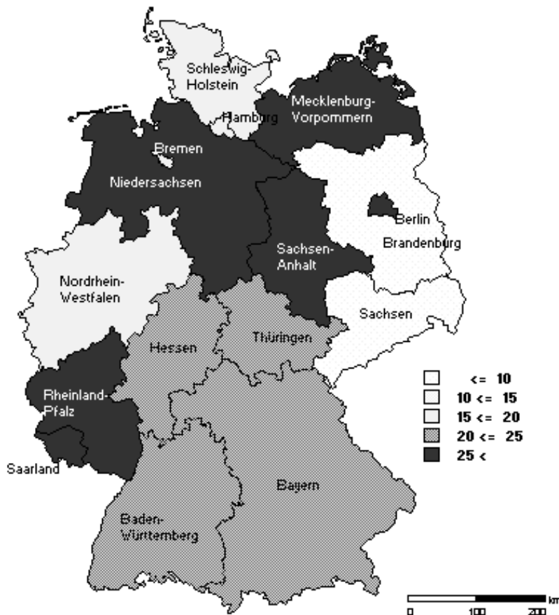
Graphik 3: Anteil ausländischer Schulabgänger/-innen ohne Schulabschluß an allen ausländischen Schülern/-innen (1991/92)