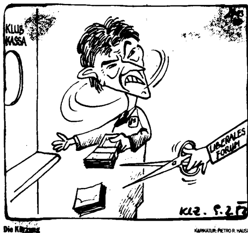
Abb. 2: Karikatur, Kleine Zeitung vom 9. 2. 1993)

des liberalen Flügels der FPÖ eine neue Partei – das „Liberales Forum“. Auffallend an der Parteispaltung ist die Tatsache, daß die Medien einhellig von „Scheidung“ sprachen. Es tauchten seltsame Formulierungen auf, z. B. daß „Jane ihren Tarzan verlassen“ habe ( Kleine Zeitung , 9. 2. 1993), Phantasien, Haider wolle Schmidt nun „killen“ ( Kleine Zeitung , 5. 2. 1993), Rückblicke wie „sie küßten und sie schlugen sich“ (ebda.). In einer Radiosendung zum Thema rief ein erzürnter Hörer an, der seiner Wut über die undankbare Heide Schmidt, die ihren Schöpfer und Förderer Haider auf so gemeine Weise verlassen habe, Ausdruck verlieh. Er identifizierte sich dabei so sehr mit Haider, daß er Aspekte seiner eigenen Scheidung mit der „politischen Scheidung“ völlig vermischte. Weiters fanden sich in den Zeitungen gehäuft Karikaturen, die an eine Kastration denken lassen, wie z. B. diese.