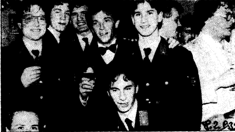
Feuerwehrleute sind für Haider „wenigstens verlässliche Anhänger“

zu brauchen. Frauen werden durch eine übertriebene Darstellung lächerlich gemacht, für überflüssig erklärt, und Haider selbst darf seine Wunden im Kreise treuer männlicher Fans lecken. Ein Foto, kurz vor oder nach eben dieser Ballnacht aufgenommen, belegt das.