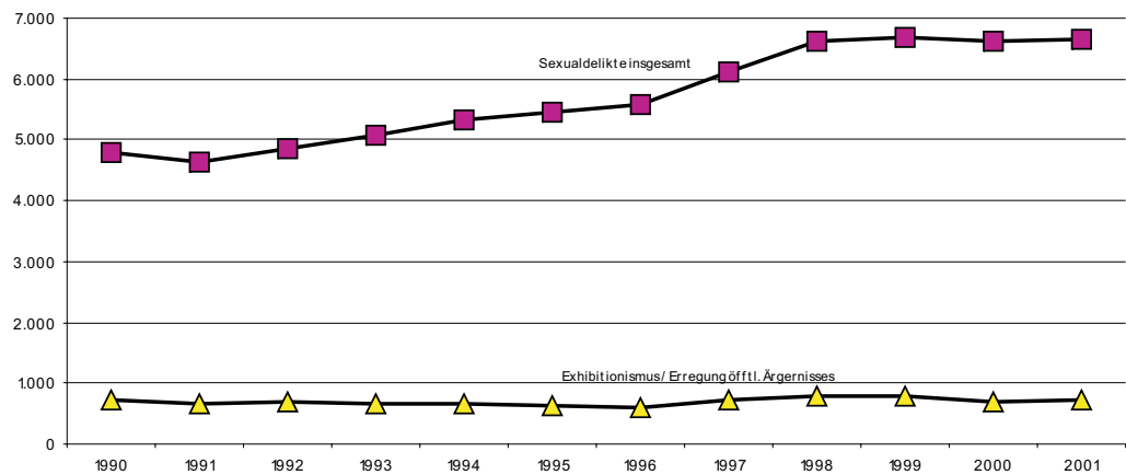
Abb. 2: Verurteilte nach allgemeinem Strafrecht und Jugendstrafrecht bei Sexualdelikten insgesamt (§§ 174 - 184b StGB) und Exhibitionismus bzw. Erregung öffentlichen Ärgernisses (§§ 183, 183a StGB) im früheren Bundesgebiet (ab 1995 mit Gesamtberlin)

Quelle: Statistisches Bundesamt: Fachserie 10: Rechtspflege, Reihe 3: Strafverfolgung.