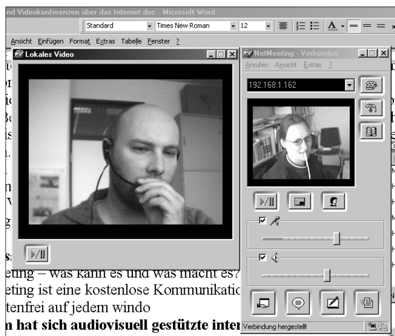
Abbildung 1: Gesprächsfenster in einer Videokonferenz mit NetMeeting (links Eigenbild, rechts Fremdbild)

Die wohl herausragendste Leistung der Software ist die IP-basierte Möglichkeit, Videokonferenzen abzuhalten. Um dieses Feature in vollem Umfang nutzen zu können, benötigen die jeweiligen Kommunikationspartner die oben genannten Hardwarevoraussetzungen. Je nach Kamera können verschiedene Auflösungen gewählt werden, die die Größe des Bildes bestimmen. Bei Verbindungen mit einem geringen Durchsatz kann die Qualität der Datenübertragung reduziert werden, sodass die Bewegungen nicht stocken. Bei einer Videokonferenz kann das Eigenbild und das Fremdbild auf dem Bildschirm platziert werden (s. Abb. 1)