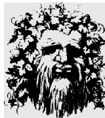
FIGURA 2 - Homem com cabelo de plantas ou casal romântico se beijando?

Poderíamos, também, partir da literatura, a exemplo deste poema de Carlos Drummond de Andrade: