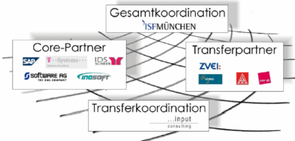
Abbildung 1: Projektnetzwerk

Das Vorhaben wird durch ein Projektnetzwerk integriert, das aus einer Kerngruppe („core“-Partner), drei Expertenforen sowie Transferpartnern besteht. Der Kerngruppe gehören neben dem ISF München die kooperierenden IT-Unternehmen an.