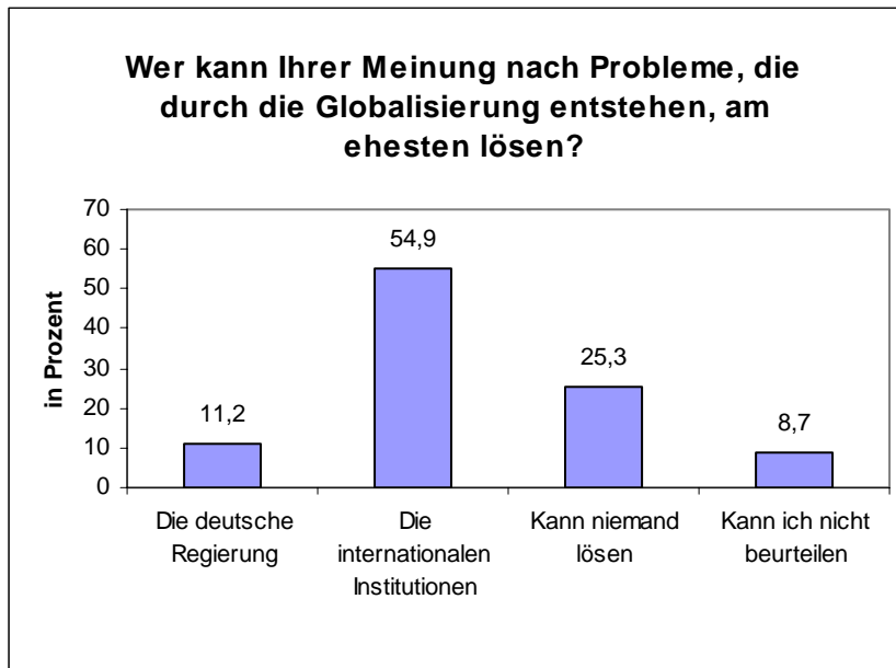
Abbildung 1: Problemlösungskompetenz: National oder international?