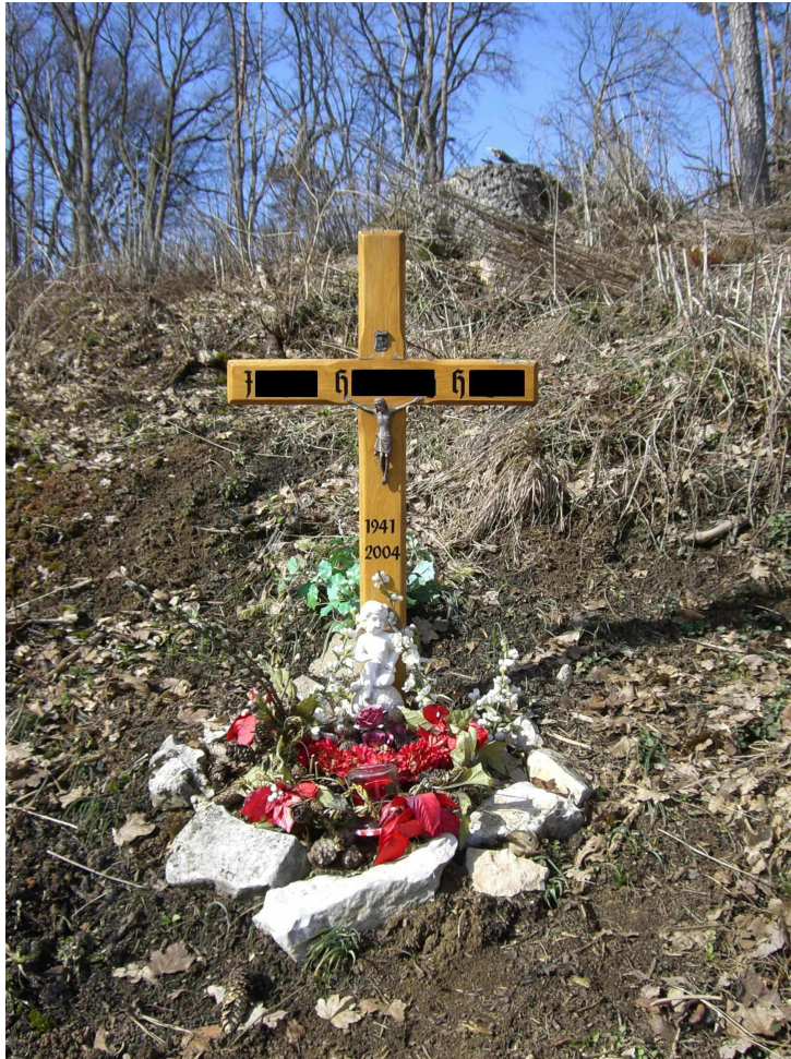
Abbildung 3: Fall (3) – Der Schutzengel am Fuß des Kreuzes symbolisiert die Dichotomie Hilfe/Hilflosigkeit.