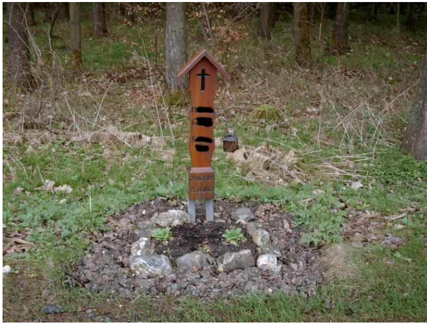
Abbildung 2: Fall (2) – Form und Gestaltung orientieren sich an den bayerischen Totenbrettern.

symbolisch wiederhergestellt werden. Bezeichnend ist hier, dass obwohl die Interviewte dem christlichen Glauben abgeschworen hat, dennoch auf die christliche Formensprache zurückgegriffen wird. Die Form und Gestaltung des Erinnerungsmals entspricht bis ins Detail den bayerischen Totenbrettern, außerdem ist ein Kreuz in das Brett eingebrennt (siehe Abb. 2).