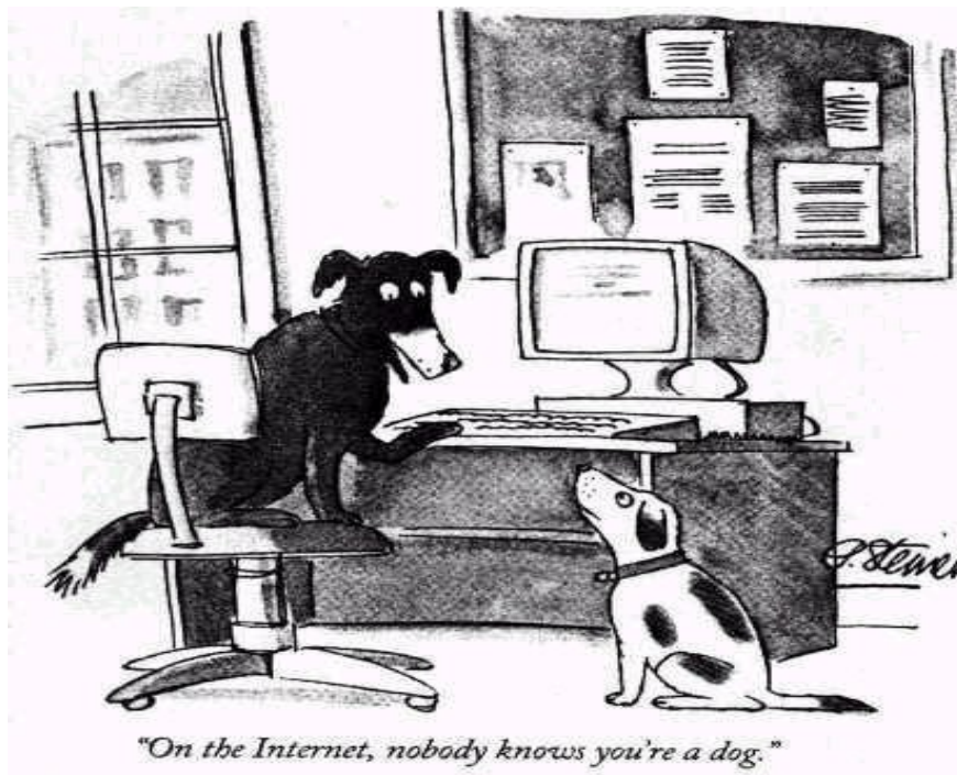
Abbildung 2: Simulationspotential im Internet.

(Quelle: Peter Steiner; in: The New Yorker July 5/1993, page 61)