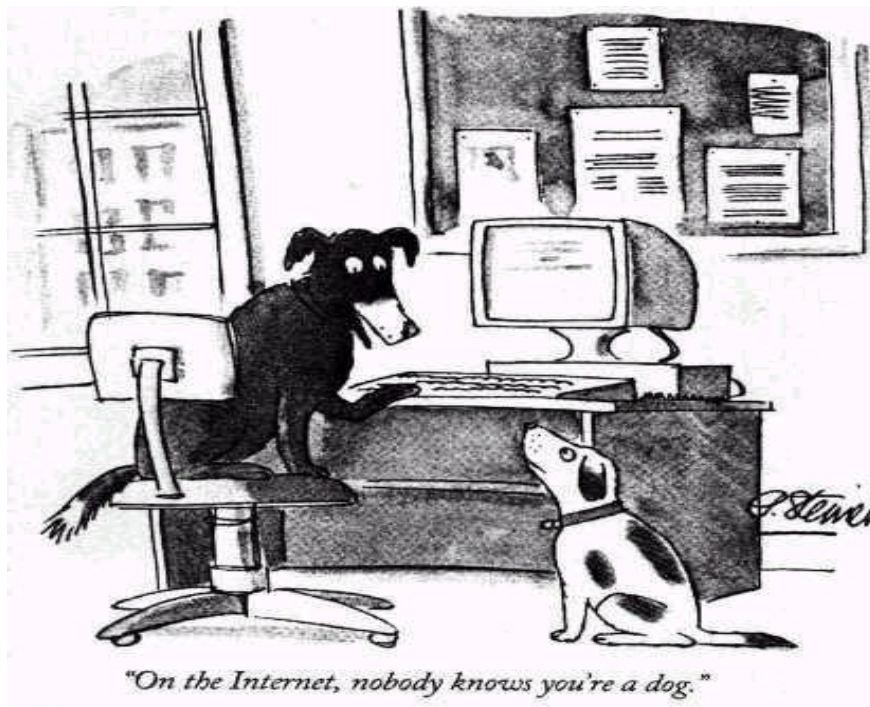
Abbildung 2: Simulationspotential im Internet.