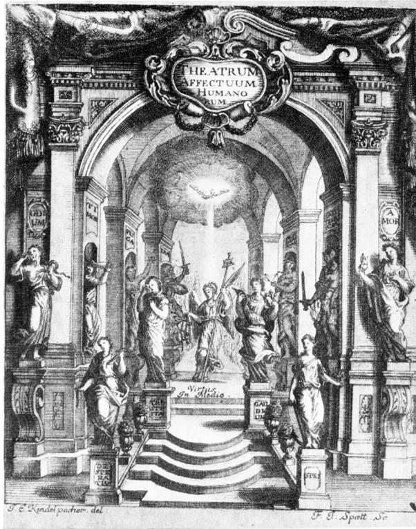
Abb. 1: Franz Lang, Theatrum affectuum humanorum , München 1717 (Titelblatt) (aus Dammann 1995)

Es gibt deutliche Grenzen und Bezüge, nichts ist dem spontanen oder expressiven Wechsel überlassen, wie er später kennzeichnend sein wird. Hier ist das Gefühlserleben statisch und objektiv, zu seiner musikalischen Darstellung gibt es vorgeschriebene Module, die Tonarten, Verläufe, Dynamiken und Modulationen betreffend. Das hat der Komponist zu können und er hat als Individuum dahinter zurückzutreten.