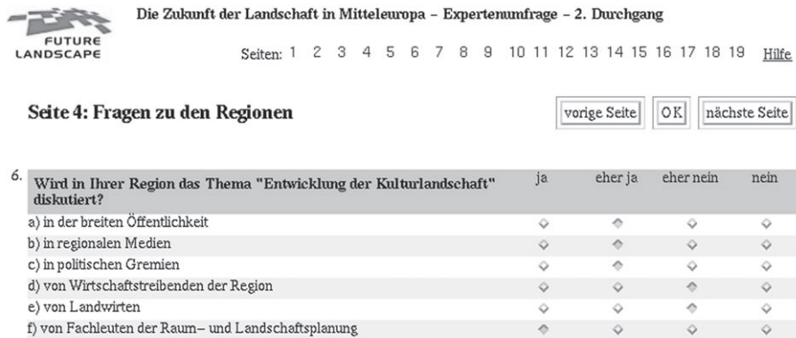
Abbildung 2: Ausschnitt aus Papier-Fragebogen