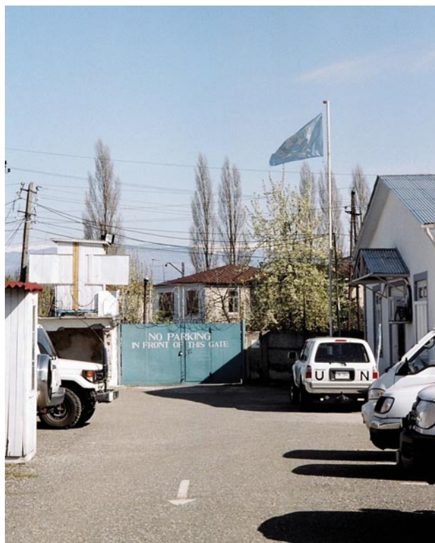
UN-Stützpunkt im georgisch-abchasischen Konfliktgebiet

Durch die einseitige Ausrufung der Unabhängigkeit des Kosovo von Serbien im Februar 2008 sowie den Kaukasus-Krieg zwischen Georgien und Russland um die Sezessionsgebiete Abchasien und Südossetien im August 2008 drangen plötzlich im Völkerrecht verwendete Termini wie Anerkennung, Präzedenzfall, Selbstbestimmungsrecht und territoriale Integrität und verschiedene mit dem Konflikt befasste internationale Organisationen in das Bewusstsein einer breiteren Öffentlichkeit. Außerdem stand die sonst eher in Randlage befindliche Kaukasusregion mit ihrer komplizierten politischen Geographie im Mittelpunkt des medialen Interesses der westlichen Welt.