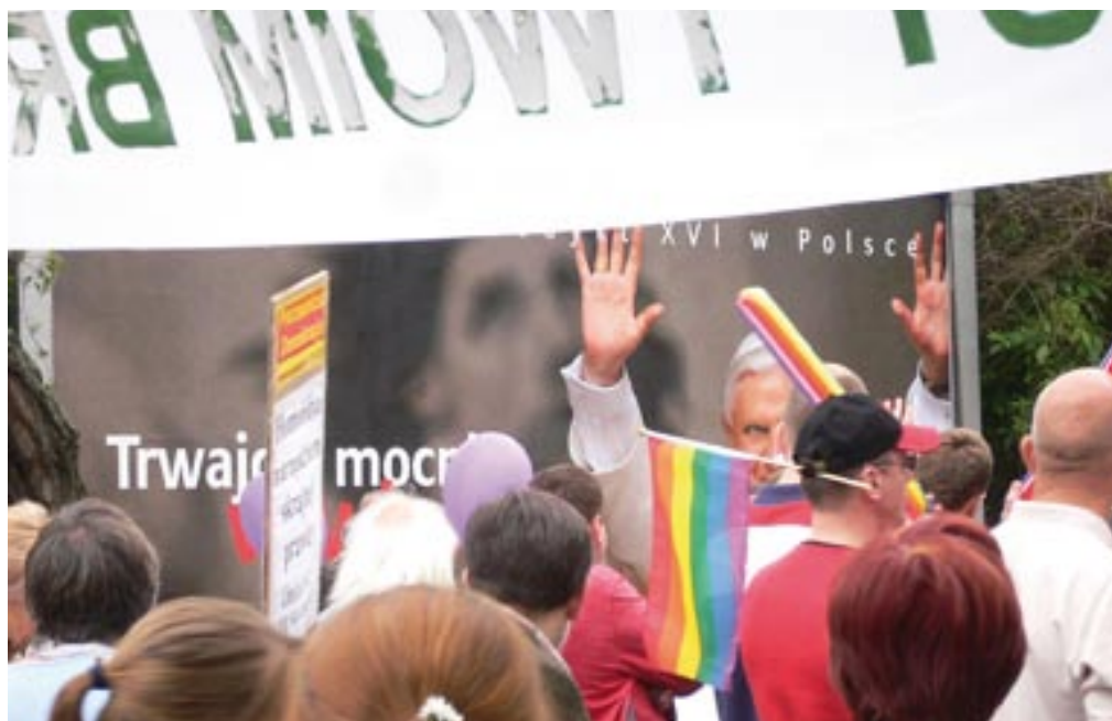
Die Demonstration »Parada równości« (»Parade der Gleichberechtigung«) in Warschau

Kirche seit dem Ende der Franco-Diktatur deutlich weniger gesellschaftlich verankert als in Italien und in Polen. Entscheidend ist aber, dass es (3) sowohl in Italien wie auch in Polen politische Entscheidungsträger gibt, die, sei es aus Populismus oder persönlichem Glauben, der moralpolitischen Linie des Vatikans folgen und gegen Liberalisierungsmaßnahmen entscheiden. In Spanien gibt es auch solche Positionen. Sie sind jedoch (4) – anders als in Polen und Italien – nur in dem politisch homogenen rechten Lager zu finden.