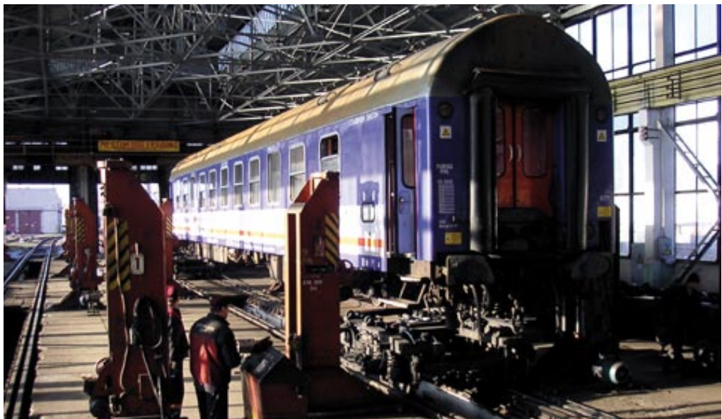
Spurwechsel in Brest an der polnisch-weißrussischen Grenze

Wir sitzen zu fünft auf einer langen sowjetischen Bettcouch, uns gegenüber einige Mitarbeiter einer Minsker Organisation für Rechtshilfe. Zuvor hatten wir uns im Stadtzentrum in einen der überfüllten Busse gequetscht, waren wenige Stationen später ausgestiegen und hatten in einem Innenhof zwischen fünfstöckigen Plattenbauten aus der Chruschtschow-Zeit den richtigen Eingang gesucht. Der Hof sieht wie alle Höfe aus, unter einer dünnen Schneedecke, die von den durchfahrenden Autos zerfurcht und dreckbespritzt ist, ragt der Müll heraus, der hier, anders als in der Stadtmitte, nicht täglich zusammengekehrt wird, da stehen Containergaragen, einige blattlose schlanke kränkelnde Bäumchen mit dünnen Kronen, rostende Kleinwagen sowjetischer Bauart, Reste von Geräten eines Kinderspielplatzes. Die Häuser sind im Gegensatz zu den stalinistischen Prachtfassaden im Zentrum unverputzt, es bröckelt der Beton, die notdürftig verglasten Balkone sind vollgestopft und eingegittert, ihre Funktion als Plätzchen an der Sonne scheinen sie längst verloren zu haben. Hinter dicken Gardinen sieht man Zimmerpflanzen, Katzenaugen und noch dickere Vorhänge hervorluken.