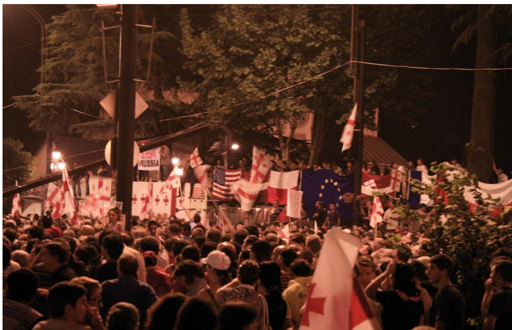
Die europäischen Sterne inmitten georgischer Kreuze

Als ich Georgiern von meinem Promotionsvorhaben erzählte, wurde ich oft mit der Frage konfrontiert, ob es nicht schwierig und gefährlich wäre, Korruptionsverbrechen zu erforschen. Mein Vorhaben zielt aber nicht auf eine Untersuchung des Ausmaßes der Korruption in Georgien und eine Antwort auf die Frage, ob Korruption seit der Rosenrevolution durch die Maßnahmen der georgischen Regierung reduziert worden ist. Die Arbeit analysiert vielmehr den Umgang verschiedener Akteure (georgische Regierung, Geberorganisationen, zivilgesellschaftliche Akteure) mit dem Konzept der Korruptionsbekämpfung. Ich gehe davon aus, dass Korruptionsbekämpfung von verschiedenen Akteuren unterschiedlich interpretiert wird. Ich versuche diese unterschiedlichen Ansätze anhand der Untersuchung konkreter Korruptionsbekämpfungsprojekten zu beleuchten. Mein Forschungsinteresse ist die Analyse der Art und Weise, wie lokale Akteure sich mit dem Import globaler Normen wie Anti-Korruptionsstandards auseinandersetzen.