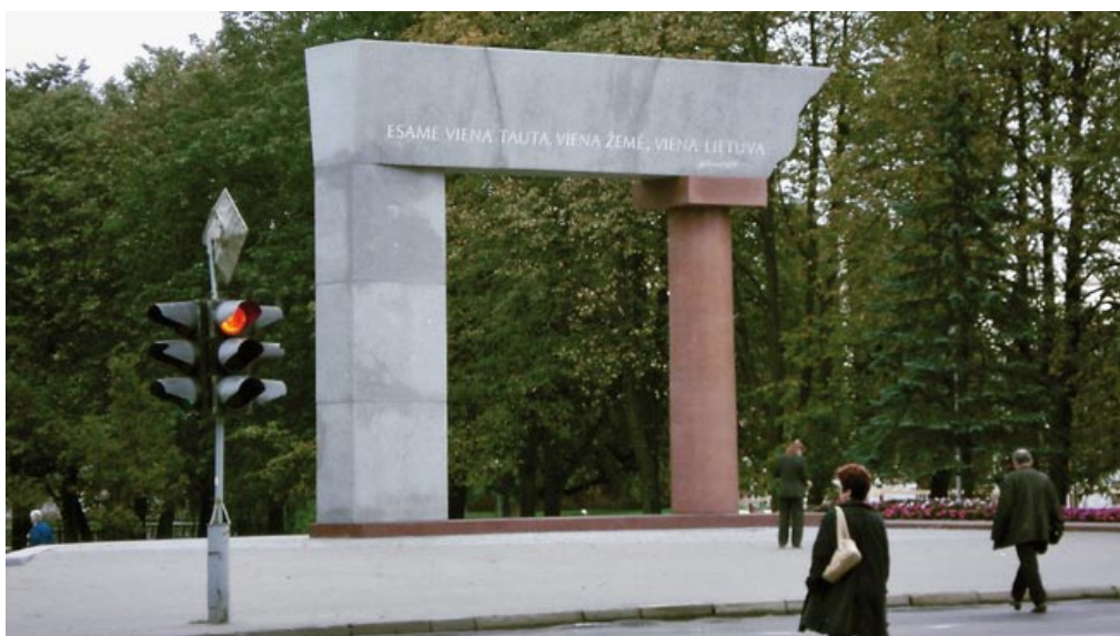
»Arca«: »Triumphbogen« zur Erinnerung an den Anschluss des Memel-Gebiets 1923 an Litauen

Im Rahmen einer Ring-Vorlesung zu Ideologien in der Zwischenkriegszeit des historischen Instituts der Universität Klaipėda trug ich einen Block zu der politischen Ikonografie der Pavillions NS-Deutschlands, der Sowjetunion und der Spanischen