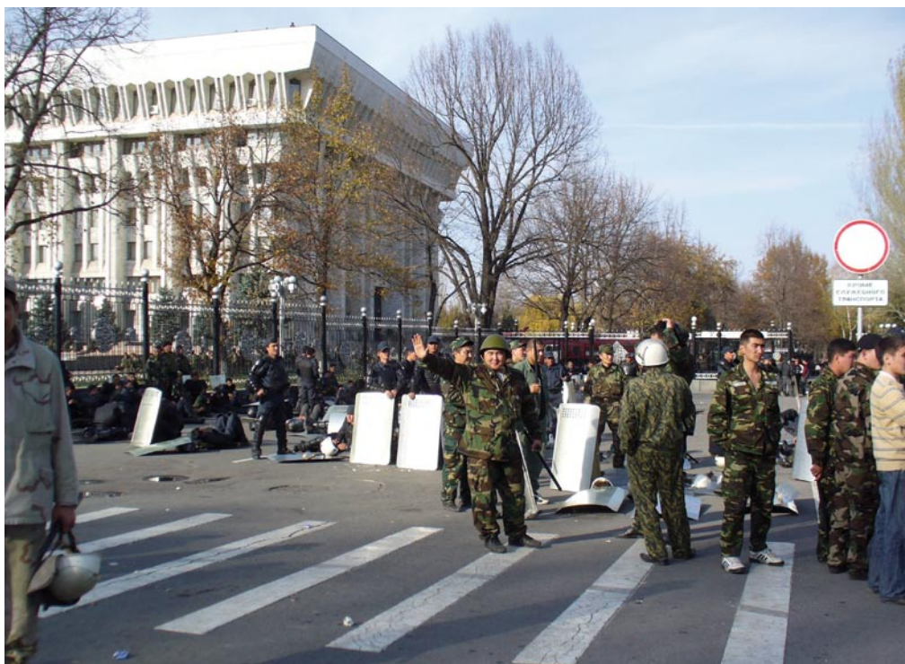
Eine Woche im November 2006: Soldaten vor dem Regierungssitz, dem Weißen Haus, beobachten gelangweilt das Treiben der Demonstranten

Dieses Kochen zu analysieren hatte ich mich aufgemacht, im Gepäck Theorien über die Wandlungsfähigkeit Hybrider Regime und Klangesellschaften in Zentralasien. Mich interessierte, inwieweit »Clans« und andere informelle Institutionen das politische Leben in Kirgistan beeinflussen. Um Antworten zu finden, wählte ich eine Provinzstadt im Norden der Republik zur Feldforschungsstätte, der ich mit Methoden aus der qualitativen Sozialforschung zu Leibe rücken wollte. Ich versprach mir von Treffen mit lokalen Politikern und Beobachtungen des Stadtlebens tiefere Einblicke in das politische Leben der kirgisischen Republik.