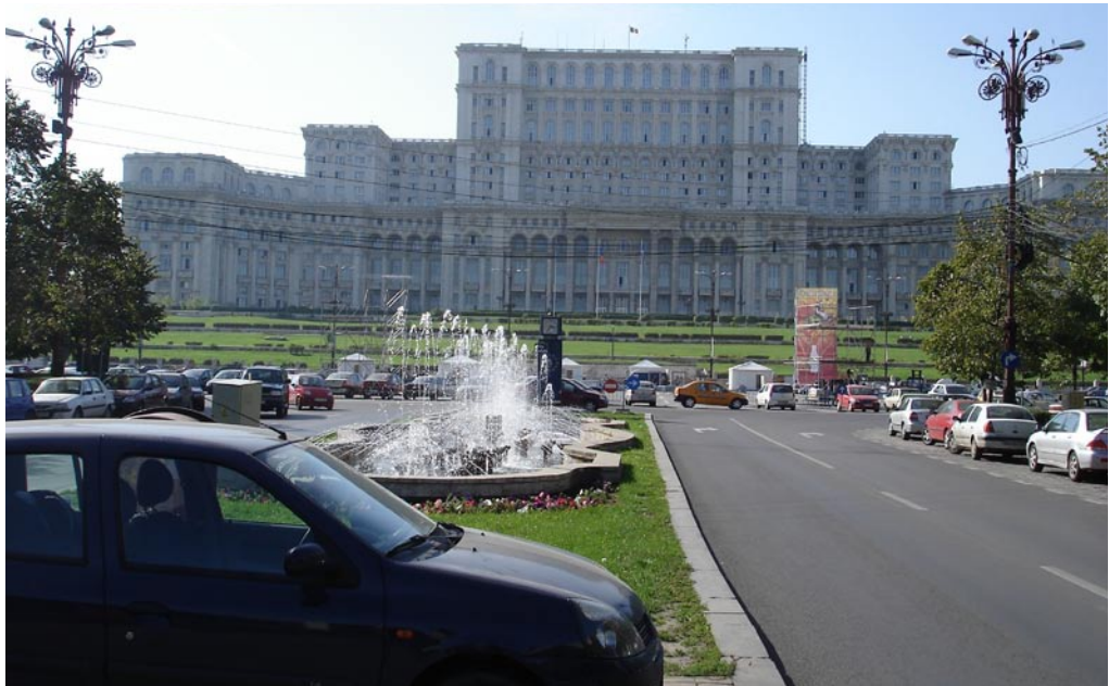
Palast des Volkes in Bukarest

das Kollegiatentreffen in Minsk – weil es mir erlaubte, einige Ausschnitte eines Alltags in einem autoritären System, von dem ich sonst nur aus den Erinnerungen meiner InterviewpartnerInnen hörte, zu erleben.