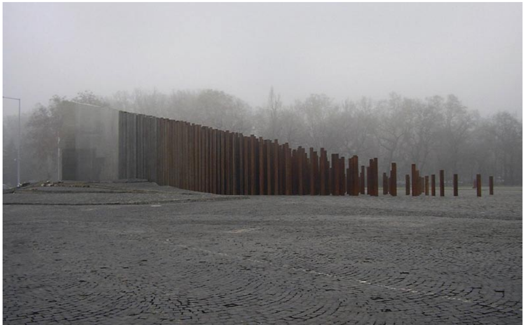
Nationaldenkmal für den Ungarischen Aufstand 1956

sind dafür Prozenzhürden im Wahlrecht ausschlaggebend, die auf Parteien von Minderheiten einen großen Druck ausüben, ihre ethnisch definierte Wählerschaft an sich zu binden bzw. sich klar von anderen Parteien abzugrenzen. Andererseits geschieht zu bestimmten Zeitpunkten in allen drei Ländern diese Polarisierung auch mit einer politischen Gegenseite, die ethnisch nationale und ausgrenzende Strategien verfolgt. Bei unzähligen Länderbesuchen und Interviews wurde klar, dass die Parteien in den drei Ländern unterschiedliche Strategien verfolgen, um im Parteienwettbewerb erfolgreich zu sein, etwa durch eine Inkorporierung von verschiedenen Interessen in einer Minderheitengruppe durch organisatorische Ausdifferenzierung, eine Bindung der Minderheit durch Leistungsdistribution, aber auch durch eine ideologische Öffnung in Richtung einer breiten Bevölkerungsgruppe. Klar wurde aber auch, dass es in allen Ländern Minderheitengruppen gibt, die im Parteienwettbewerb nicht erfolgreich sind – am prominentesten die Roma-Gruppen. Die Arbeit lässt auch den Schluss zu, dass die politischen Systeme in allen drei Ländern noch keine ausreichend funktionalen Instrumente ausgebildet haben, die eine Interessensartikulation der Minderheiten abseits des Parteienwettbewerbs zulassen.