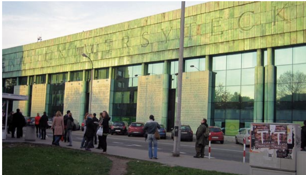
Die Universitätsbibliothek in Warschau

Ferner wird aufgezeigt, dass bis zum Ende der 1990er Jahre die wirklichen »Strippenzieher« der polnischen Politik meist außerhalb des Kabinetts blieben. In das schwierige Amt des Chefs von chronisch instabilen Koalitionsregierungen wurden stattdessen politisch relativ unbedeutende »Marionetten« entsandt, die von ihren Parteivorsitzenden gelenkt wurden. Folglich erlangten Personen, die bestenfalls durch parteipolitische Willensbildungsprozesse legitimiert worden waren, einen erheblichen Einfluss auf die Arbeit der parlamentarischen Exekutive. Auch mit dieser aus demokratietheoretischer Sicht bedenklichen Entwicklung kann womöglich die zurückhaltende Wahlbeteiligung bei den Parlamentswahlen der 1990er Jahre sowie der – zumal für neue Demokratien – bedenkliche Vertrauensverlust in die Institution Regierung erklärt werden.