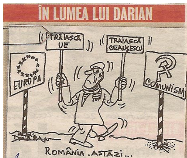
»Gleichzeitigkeit von Ungleichzeitigkeiten« in Rumänien 2006 (Die Aufschriften bedeuten: »Es lebe die EU« | »Es lebe Ceaușescu«, »Rumänien heute ...«; aus: Libertatea, 20.12.2006, S. 2)

Ich habe die Zeit des Promotionskollegs als unheimlich austausch-stark in Erinnerung, da ich in ganz verschiedenen Kontexten die eigenen Arbeitsthesen und Zwischenergebnisse erproben konnte. Dazu gehörten zuallererst spannende Diskussionen im Rahmen des Unterrichts mit Masterstudierenden in Geschichte