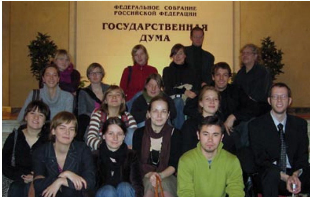
Mit den Projektteilnehmern in der russischen Staatsduma

Wielgohs geleiteten MA-Seminars an der Viadrina und semesterbegleitende Unterrichtsveranstaltungen im Rahmen des Lektorats am FRDIP.