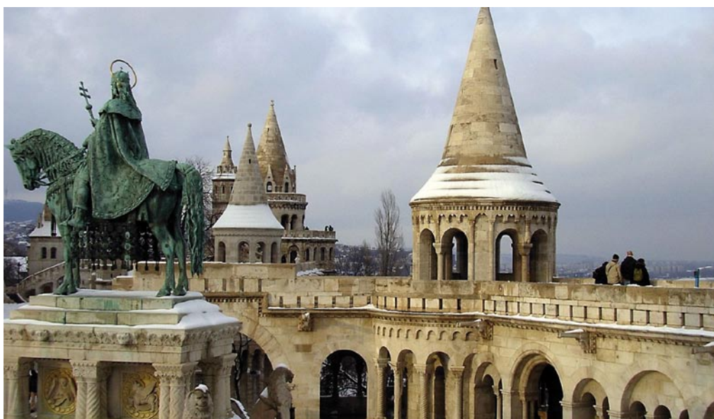
Fischerbastei in Budapest

in Budapest, die »ihre« Minderheiten in Rumänien oder der Slowakei verteidigten, das Unverständnis vieler Bulgaren/-innen und Rumänen/-innen für Minderheiten in neu aufwallenden nationalistischen Gefühlen und recht klaren Meinungen über das, was bulgarische, rumänische oder slowakische Identität bestimmt und was nicht. Bei einem Forschungsaufenthalt am Flensburger European Centre for Minority Issues (ECMI) konnte nicht nur der wissenschaftliche Hintergrund der Forschung erweitert, sondern auch Einblick in vielfältige praktische Projektarbeit in Südosteuropa oder im Kaukasus zur Stärkung von Minderheitenpartizipation gewonnen werden. Der Rahmen des Kollegs ermöglichte auch fachliche Einblicke in andere Wissenschaftsdisziplinen und einen regen Erfahrungsaustausch über Lebenswelt von Ungarn bis Kirgistan und unzählige Kontakte für die Zeit nach dem Kolleg und der Promotion.