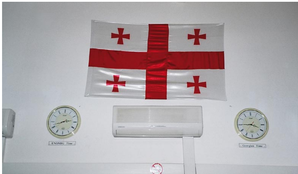
UNOMIG- und Georgien-Zeit

orgischen Seite der Waffenstillstandslinie prangte an der Wand im Aufenthaltsraum die neue georgische Nationalflagge flankiert von zwei Uhren – UNOMIG Time und Georgian Time. Die Vereinten Nationen leisteten sich also für ihre Mission in Georgien eine eigene Zeit, die der Georgischen eine Stunde hinterher läuft. Warum? Erhellung brachte die Fahrt nach Suchumi in das abtrünnige Abchasien. Dort tickten alle Uhren nach Moskauer Zeit, also im Winterhalbjahr mit einer Stunde Unterschied zur Tifliser Zeit. Warum hat aber auch die Mission der Vereinten Nationen, die Georgien im Namen führt und für dessen territoriale Integrität eintritt, »Separatistenzeit« bzw. Moskauer Zeit? Ganz einfach: Das operative Hauptquartier der UN-Mission liegt nun einmal im abchasisch-kontrollierten Suchumi. Praktische und diplomatische Lösung: UNOMIG Time!