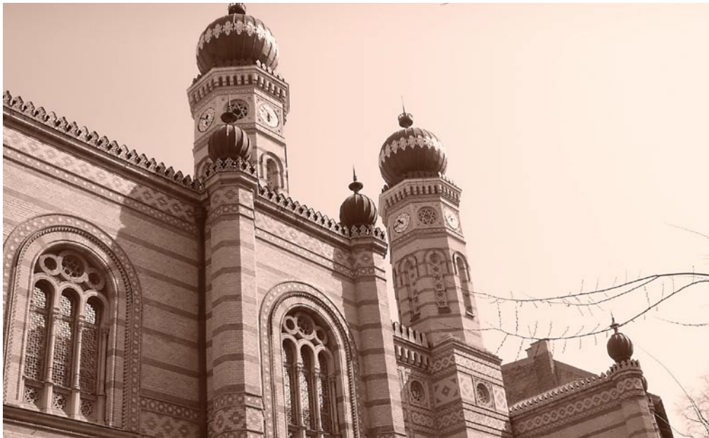
Synagoge in Budapest

um die jeweils neue Realität ihres Seins (als unfreier Häftling im Lager, als Fremde in der Emigration...) zu bewältigen, wird unter Beachtung des Alters, der religiösen und sozialen Herkunft sowie der Geschlechtszugehörigkeit herausgearbeitet. Als Interpretationsmethode wurde eine qualitative Inhaltsanalyse in der Tradition der Hermeneutik gewählt, die menschliches Verhalten verstehen und nicht erklären will. Sie fragt, wie sich die erzählende Person selbst darstellt und wie sie über den Umgang mit ihren lebensgeschichtlichen Erfahrungen berichtet. Dabei werden die Erzählungen auf der Ebene des erlebten und auf der des erzählten Lebens sowie der Bedeutung für die retrospektive Betrachtung ihres Lebens analysiert. Vor allem bei Fragen nach den Identitätskonzepten und Lebensentwürfen der Frauen konnte so der Versuch unternommen werden zu verstehen, »wie sich ein Mensch den Gang seiner eigenen Entwicklungsgeschichte plausibilisiert, erklärt und wie