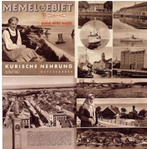
Prospekt »Memelgebiet« mit Fotografien von Paul Isenfels, nach 1939

Jenseits von nationalstaatlicher Identität scheinen Regionen authentischere Angebote der Selbstvergewisserung bereit zu halten, um den Einzelnen für die Herausforderungen einer globalisierten Welt kulturell zu wappnen. So betonen auch Normen politischer Richtlinien und Abkommen, wie die Landschaftsschutzkonvention des Europarates die essenzielle Bedeutung der Identifizierung von Menschen mit dem Gebiet, in dem sie leben, für eine nachhaltige Entwicklung einer Region und Europas insgesamt. Dem ehemals zu Ostpreußen gehörenden Preußisch-Litauen, heute zwischen dem Kaliningrader Gebiet und Litauen geteilt, bieten sich in dieser Hinsicht viel versprechende Perspektiven: Das multiethnische Kulturerbe stellt eine bedeutende Ressource für die Wachstumsbranche Tourismus dar. Die sich eröffnenden Möglichkeiten werden jedoch nur zu einem geringen Grad ausgeschöpft. Neben strukturellen Problemen der transregionalen Zusammenarbeit – über die EU-Außengrenze hinweg – liegt es nahe, einen weiteren Grund für die nur zögerliche Inwertsetzung der Vergangenheit darin zu vermuten, dass nur ein Teil des Kulturerbes die Schwelle zu den Kaliningrader und litauischen Selbstbildern in der Region passiert. Das als »deutsch« empfundene Erbe bleibt größtenteils fremd und entzieht sich somit nicht nur einer Vermarktung, sondern auch der entsprechenden Pflege.