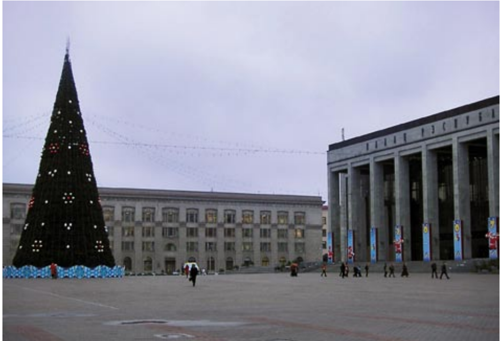
Weihnachtsdekoration vor dem Palast der Republik in Minsk

geht aus, statt des Präsidenten sehen wir Schwanensee. Begeistert stimmen wir letztlich in den Applaus des ausverkauften Hauses ein, es lebe Weißrussland!