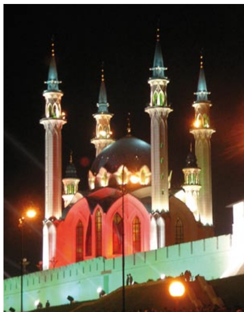
Der Kreml von Kasan

Anhand einer quantitativen und qualitativen Untersuchung der Kontakte der Republik Tatarstan zu anderen russischen Regionen wurde überprüft, welche offiziellen Formen der regionalen Kooperation und Koordination sich im postsowjetischen Russland entwickelt haben. Längere Vor-Ort-Aufenthalte in Moskau und Kasan wurden ergänzt durch Forschungsreisen in andere Regionen, in denen Tatarstan Ständige Vertretungen oder Handels- und Wirtschaftsvertretungen eingerichtet hat. Dabei konnte festgestellt werden,