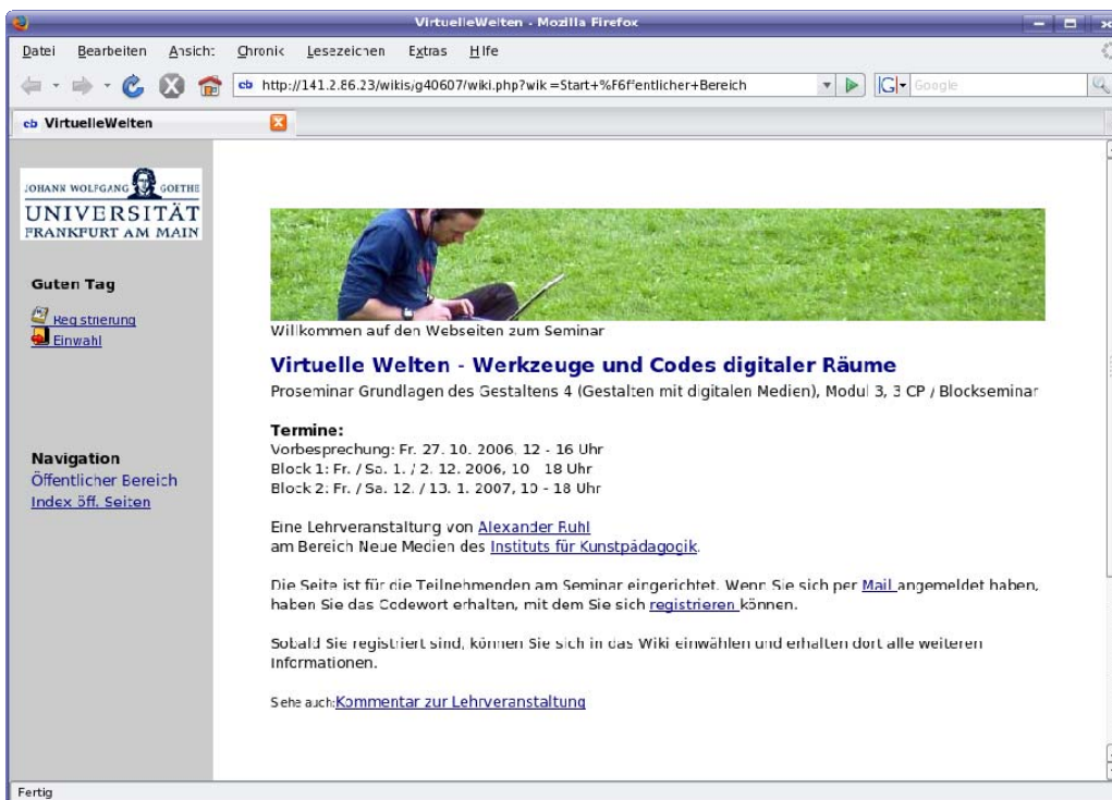
Abbildung 1: Öffentlich zugängliche Startseite mit Link zur Selbstregistrierung

In EdWiki, der hier zugrunde liegenden Wiki-Software 4 , ist bereits die Anmeldung der Nutzenden für den internen Bereich der seminarbegleitenden Wikis möglichst einfach gehalten. Als Administrator lässt sich ein Codewort definieren, das für die Anmeldung erforderlich ist und den Studierenden in der ersten Sitzung mitgeteilt wird. Wenn eine onlinegestützte Vorbereitung ohne vorheriges Treffen erforderlich ist, wird dieses Lösungswort per E-Mail versendet, zusammen mit der URL des Wikis und einer kurzen Anweisung, wie die Registrierung und darüber der Einstieg ins Seminar verläuft. Dafür sind neben dem Codewort lediglich die Angabe des Namens, einer E-Mail-Adresse und die Wahl eines Kürzels für den künftigen Login erforderlich. Der Link zur Registrierung ist auf der öffentlichen Startseite des Wikis gleich links oben zu sehen, noch über dem zur Einwahl in den internen Bereich. Daneben enthält der öffentlich zugängliche Teil nur statische Informationen zur Lehrveranstaltung, wie Termine, Zeiten, AnsprechpartnerInnen und den Kommentar.