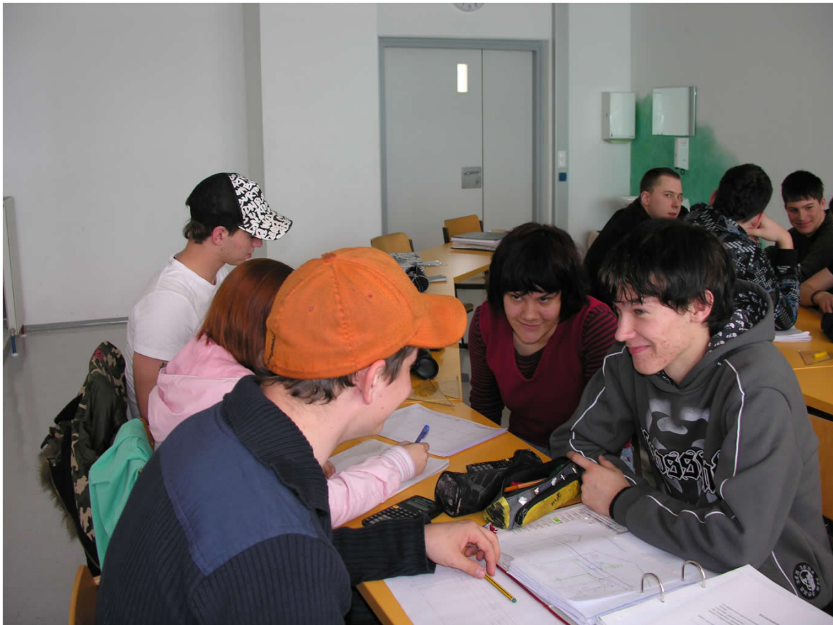
Abbildung 2: Gruppenarbeit im Rahmen der interaktiven Contenterstellung

Aus diesen drei Themen wählten die Auszubildenden je eines aus und reflektierten ihre eigenen Erfahrungen dazu. Dies erfolgte zunächst schriftlich, da das Verschriftlichen von Gedanken die Selbstreflexionsfähigkeit fördert (Schachtner 2008c: 63). Das Schreiben ermöglicht eine intensivere Auseinandersetzung mit den eigenen Gedanken, da dafür mehr Zeit erübrigt wird als für die gesprochene Sprache. Schließlich wurden auf Basis von Freiwilligenmeldungen Interviews mit sechs Lehrlingen geführt. Diese wurden auf Tonband aufgezeichnet und ebenso wie die Filme im Medienlabor des Instituts für Medien- und Kommunikationswissenschaft geschnitten sowie für das Web konvertiert.