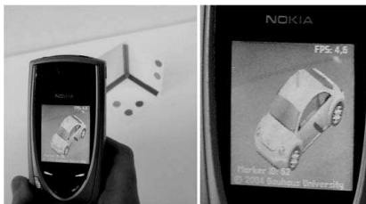
Abb.2: :A first prototype on a conventional consumer cell phone