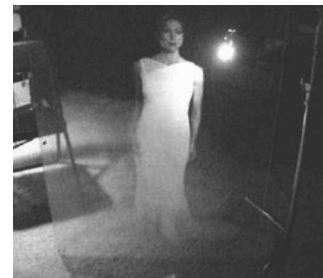
Abb.3: Transparent projection screen

Geht man von den vorangegangenen Beobachtungen aus, scheint die AR-Technologie als Querschnittstechnologie mit ihren vielfältigen Anwendungs- und Realisierungsmöglichkeiten sowie den zahlreichen Entwicklungssträngen besonders geeignet, um Prozesse der Identitätsbildung zu untersuchen. Bislang stellte sich die ‚Identität der Technik‘ mehr oder weniger deutlich als etwas dar, das die Technik zu einer Technik macht, das ihr – sei es auf stofflicher oder sozialer Basis – über ihren Verlauf (ihre Biographie) hinweg eine Wiedererkennbarkeit als eben dieser Technologie verleiht. Im Folgenden wird dem Begriff ‚Identität der Technik‘ am Beispiel der AR-Technologie nähere Beachtung geschenkt und ein