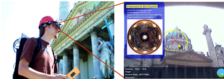
Abb. 1: Augmented Reality-Realisierung mittels Head-Mounted-Display (HMD)

Vielfaches an weiteren Nutzerkontexten wie beispielsweise Konsum, Architektur, Wissenschaft (z. B. Archäologie und Geographie), Outdoor etc. hinzugekommen. Vor diesem Hintergrund überrascht es nicht, dass die stoffliche 3 Realisierung der AR-Technologie eine immense Spannweite aufweist, denn hier handelt es sich wie bei den meisten Hochtechnologien nicht „um eine einzelne Technologie, sondern um ein komplexes Geflecht [...] von vielen verschiedenen Techniken [...], die auf einen Zweck hin kombiniert werden“ (Rammert 2000: 42). Wie vielfältig die Realisierungsmöglichkeiten sind, veranschaulichen die folgenden Abbildungen. In allen drei Fällen handelt es sich um Realisierungen der AR-Technologie, jedoch auf einer völlig unterschiedlichen stofflichen Basis.