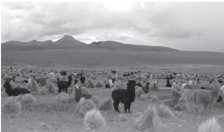
Figura 4. Rebaño de alpacas en el Parque Nacional Sajama (Provincia de Oruro, Bolivia). Nótese la creación de parches sin vegetación y la ausencia de corrales, característicos del pastoreo de camélidos.