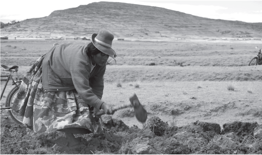
Figura 6. Mujer campesina de la Comunidad Campesina Caritamaya (Distrito de Ácora, Puno, Perú) participando en la construcción comunal de campos elevados para su cultivo en aynuqa .

cos teóricos opuestos y complementarios: el de la “arqueología del desarrollo”, entendida como el estudio del resultado de acciones pasadas, y el de la “arqueología para el desarrollo”, entendida como el estudio de un medio de acción. Para ello será necesario distinguir y posicionarse frente a las intenciones de agentes estatales, no gubernamentales, y discutir la ética y perspectivas de la práctica disciplinar frente a las identidades indígenas, criollas, mestizas –nacionales o globalizadas– de América Latina. Las drásticas alzas en los precios mundiales de los productos agrícolas que forman la base de la alimentación mundial han dado lugar a una crisis alimentaria, forzando una urgente discusión en torno a las formas en que se producen, distribuyen y consumen los alimentos (Ver figura 6).