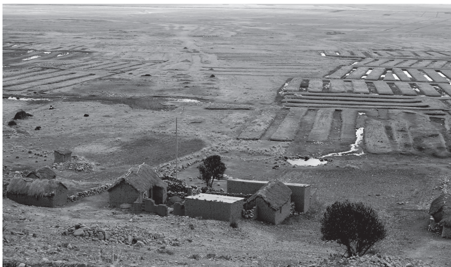
Figura 3. Campos elevados restaurados y abandonados en la década de 1990 en Pampa Khoani (Provincia de Los Andes, departamento de La Paz, Bolivia). En primer plano se aprecia un grupo de viviendas tradicionales de la localidad de Curila.

Los debates académicos, han girado en torno a los orígenes, crecimiento y abandono de esta tecnología. Dos posiciones han dominado la discusión, hasta