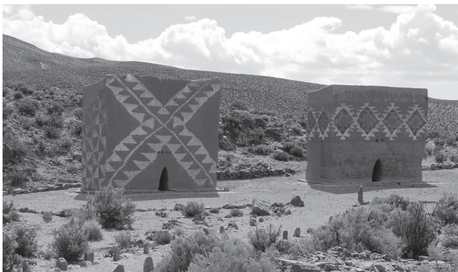
Figura 2. Monumentos funerarios chullpa en el valle alto del río Lauca (Prov. Oruro, Bolivia). Los tepes con que están contruidos son “ladrillos” con alto contenido de gramíneas y arcilla de colores, lo que ha permitido una óptima conservación de los diseños. Recientes esfuerzos de restauración han empezado a arrojar luces sobre la ampliamente difundida –y pobremente conocida– arquitectura en tepes característica del área Uru, Chipaya.

tiempo, materiales orgánicos, barro y piedra en sus viviendas, templos, tumbas, y las demás estructuras que hacen parte de su cultura material (Muelle 1978). En este campo, los intentos de recuperación se han limitado principalmente a una serie de experimentos que han conseguido demostrar y mejorar las calidades sismorresistentes de la arquitectura tradicional en adobe de la región (Zegarra et al. 2001).