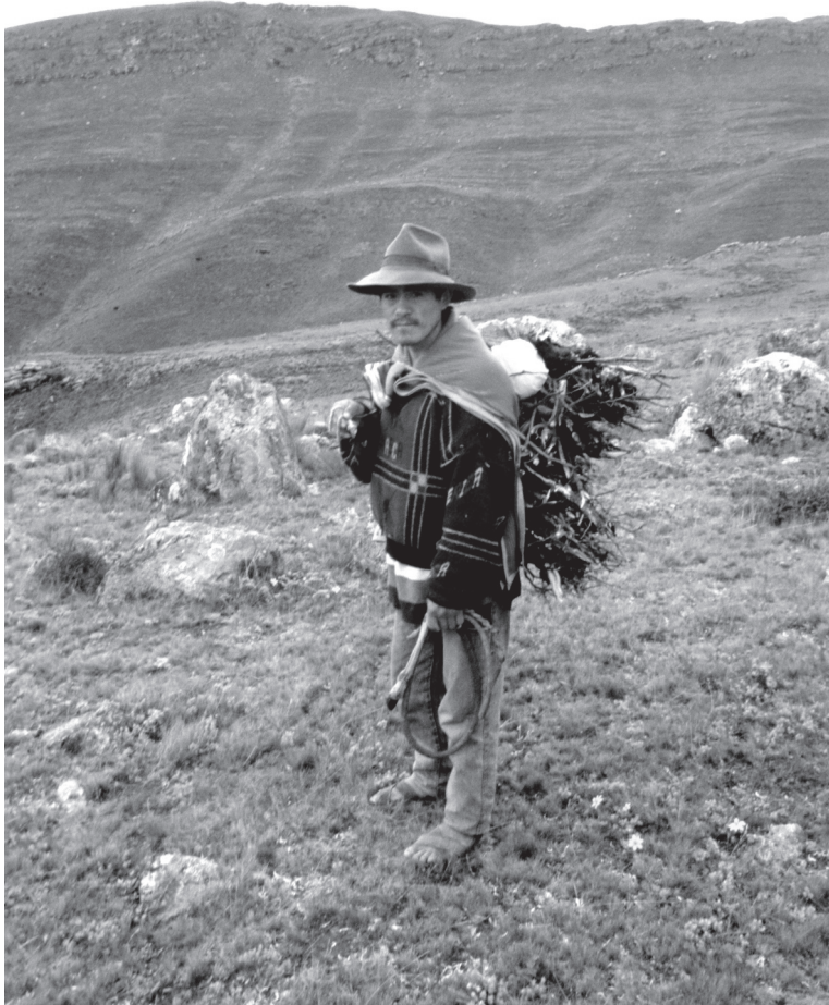
Figura 5. Campesino peruano cargando leña. La silvicultura tradicional, a pesar de su indiscutible impacto sobre el paisaje, permite mantener un equilibrio sostenible. Foto: PIA Paurarku, 2003.

lizados sobre columnas de sedimentos, como aquella –de 6,3 m de largo– extraída de la recientemente colmatada laguna de Marcacocha, ubicada a 3.300 m de altitud, en el valle de Patacancha. Los análisis a alta resolución del polen y los sedimentos depositados en el fondo de esta laguna sugieren a los investigadores del equipo liderado por el botánico británico Alex Chepstow-Lusty (2000, 2003) que el aliso fue utilizado para reforestación a gran escala desde el año 1100 de nuestra era, aproximadamente. Esto concuerda grosso modo con los resultados obtenidos por Barbara Hansen y colegas (1994) en la laguna de Paca, en la sierra central del Perú. Sin embargo, para responder inquietudes en torno a las tecnologías agroforestales particulares de una época o región determinadas será necesario realizar más estudios, con vistas a mejorar las presen-