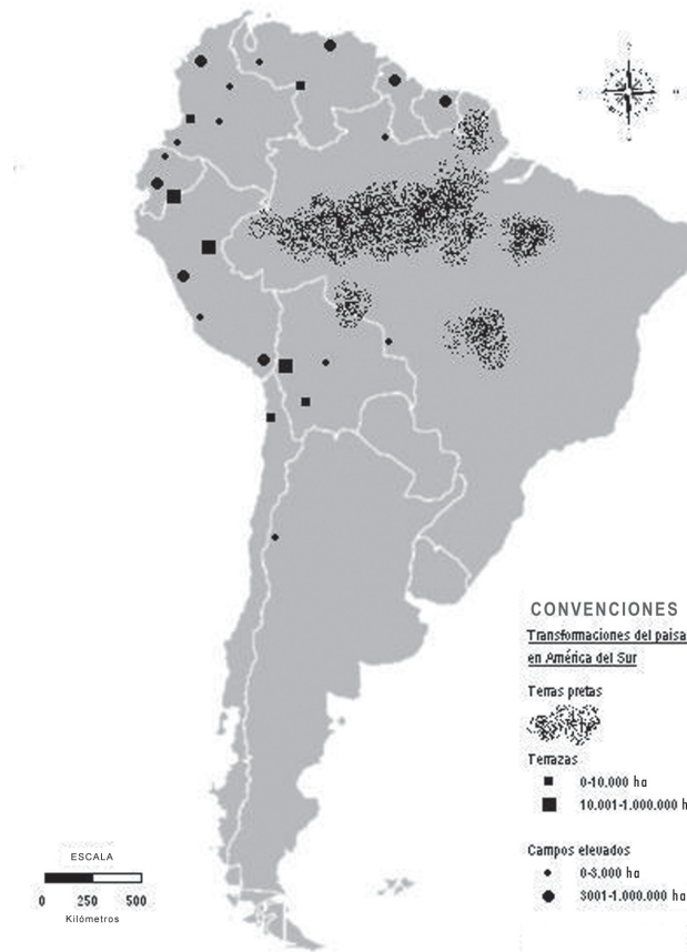
Mapa 1. Distribución general de los principales paisajes antrópicos en América del Sur (redibujado por Maurizio Ali, con base en Herrera (en prensa: Fig. 1).

y diversas ONG a lo largo de las últimas tres décadas nos permitirá poner en relieve las profundas diferencias entre las “prácticas medioambientales” indígenas y occidentales, así como el potencial de las tecnologías indígenas del pasado para afrontar los retos del presente.