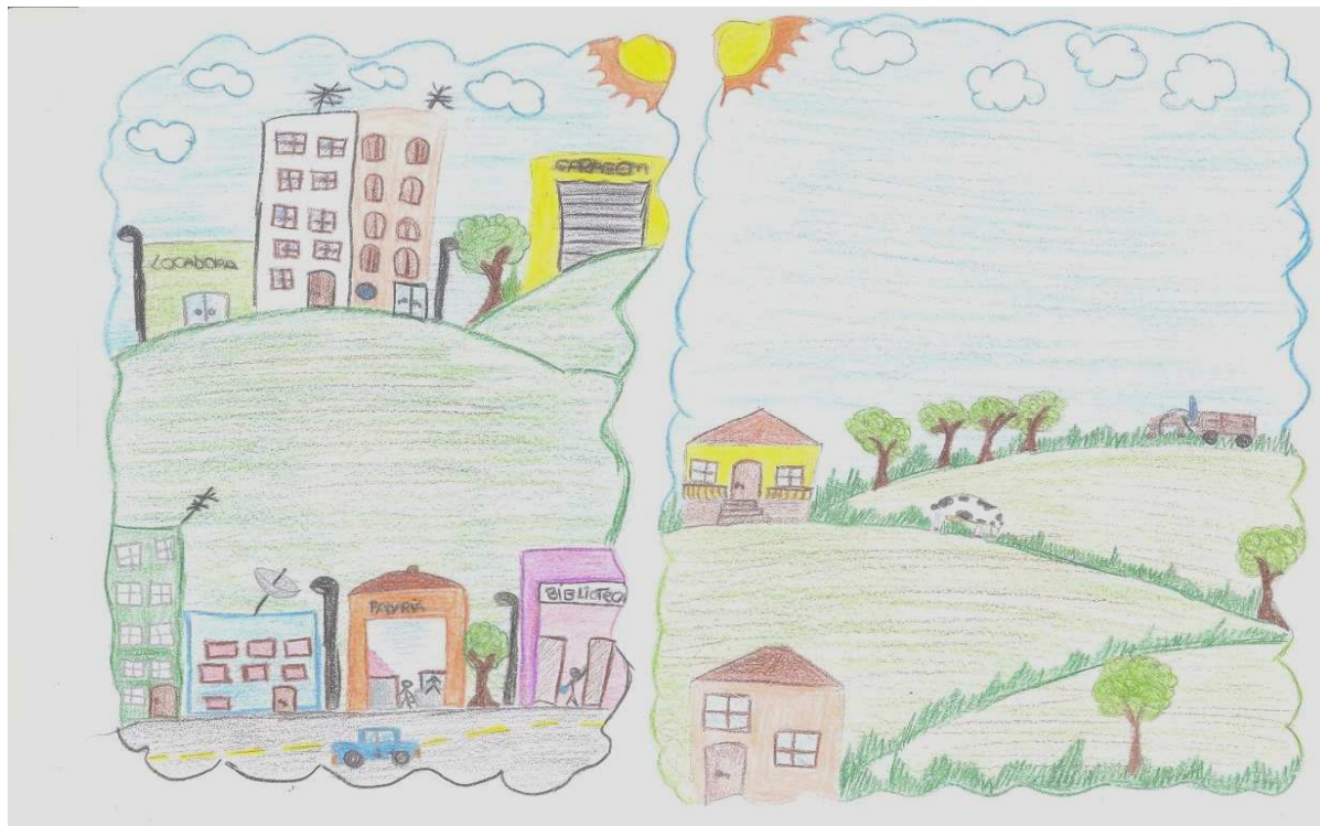
FIGURA 3: Autora do desenho: Laura - 10 anos