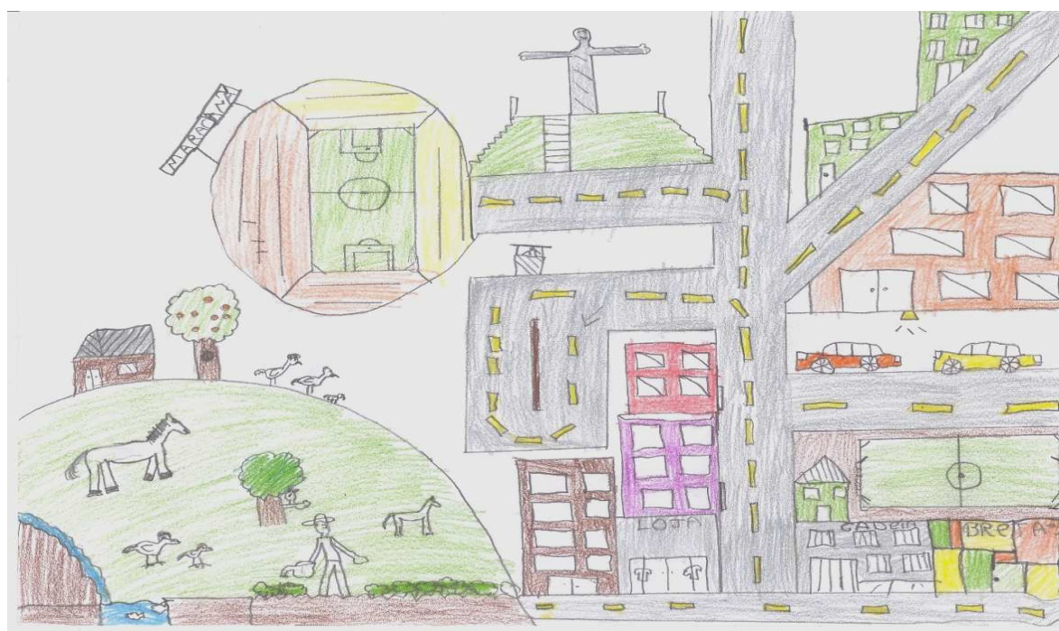
FIGURA 2 – Autor do desenho: Mateus - 11 anos