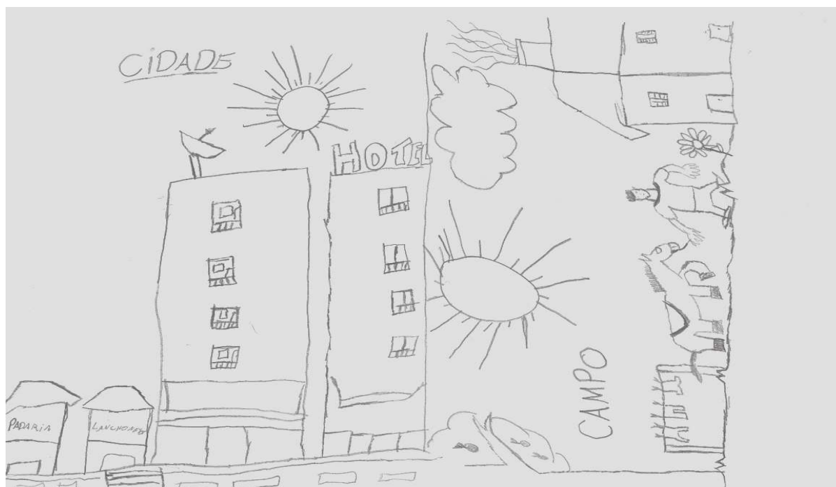
FIGURA 4 – Autor do desenho: Maycon - 10 anos