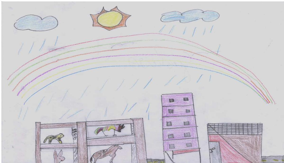
FIGURA 5 – Autor do desenho: Gustavo – 10 anos

A partir dos desenhos das crianças, extensos diálogos foram estabelecidos gerando um grande volume de falas 4 . Ante a impossibilidade de apresentar todas elas, alguns trechos das conversas com as 12 crianças participantes foram selecionadas.