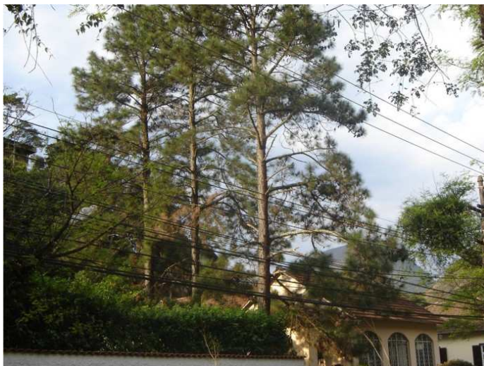
FIGURA 3 – Árvore fotografada por Rafaela