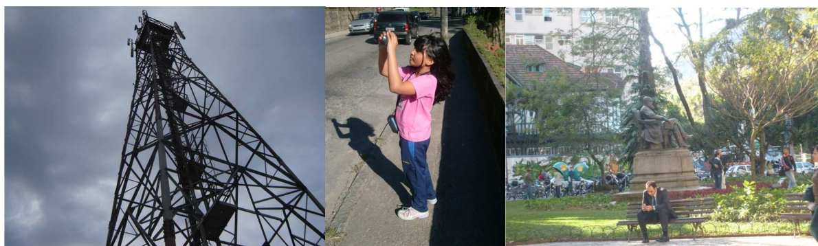
FIGURA 6 – Torre de telefonia celular