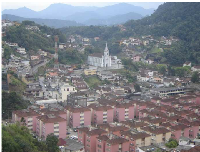
FIGURA 2 – Bairro Alto da Serra, fotografado por Bruno

A escolha das crianças a respeito desses lugares que desejavam retratar vai ao encontro do que nos diz Benjamin (1994, p.103): “Nenhuma obra de arte é contemplada tão atentamente em nosso tempo como a imagem fotográfica de nós mesmos, de nossos parentes próximos, de nossos seres amados”.