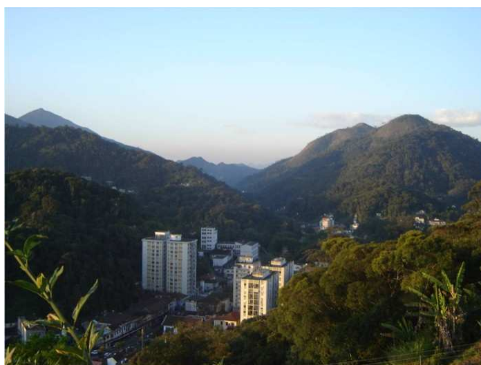
FIGURA 4 – Vista panorâmica da cidade