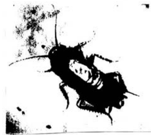
Abb. 4 Das von der Initiative angefertigte Plakat zur Kakerlakenaktion. Das Plakat wurde in mehrere Sprachen übersetzt und in der Unterkunft aufgehängt. Es herrschte auch in der Initiative Unklarheit darüber, ob Kakerlaken tatsächlich eine Gesundheitsgefährdung für die Bewohner darstellten. Zur Unterstreichung der Bedeutung der Aktion wurde es sicherheitshalber aber behauptet.