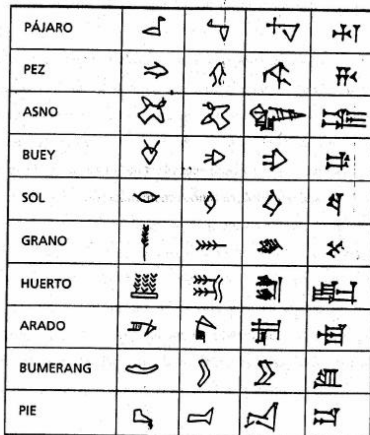
Origem pictórica de dez signos cuneiformes A. Poebel, foto nº 27 875 do Oriental Institute, citado por GELB, 1976, p. 102.

Um exemplo que fala por si é a análise da transformação sofrida pelos primitivos signos icônicos que estavam na base da escrita cuneiforme e que, paulatinamente, afastam-se dos primitivos desenhos para, na forma final, estarem tão convencionalizados que sua origem icônica é irreconhecível, como se vê na figura a seguir.