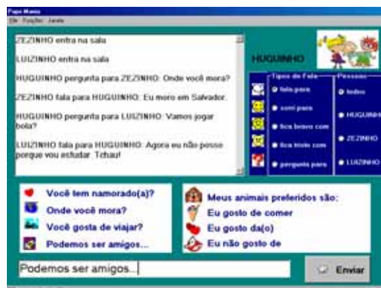
FIGURA 1 - Instantâneo de tela do Papo-Mania

Como resultado, a interface gráfica do chat contém características facilitadoras da comunicação entre os usuários referidos. Existem alguns modos de expressão de fala que estão associados a ícones que representam fisionomias (sorri para, fica triste com, fica bravo com) ou expressões da linguagem (fala para – balão, pergunta para – interrogação).