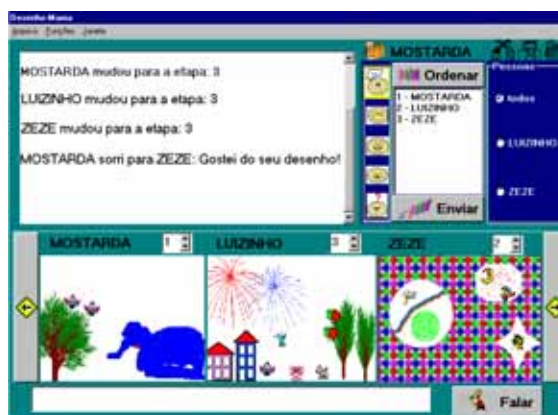
FIGURA 2 - Instantâneo de tela do Desenho-Mania, na fase 3

Este trabalho envolve o estudo e o design de ambientes fundamentados em princípios de interação humano-computador, aprendizado colaborativo apoiado por computador e abordagens construtivistas em educação, para possibilitar a colaboração síncrona à distância entre estudantes através da Internet. O Desenho-Mania (Figura 2) é um sistema de software proposto para contemplar e valorizar aspectos pedagógicos construtivistas, possibilitando o desenvolvimento de trabalho cooperativo à distância, o compartilhamento de metas, a interação em grupo e a colaboração entre crianças. Além da criação conjunta do grupo de crianças, ele possibilita análises significativas do desempenho das crianças em atividades cooperativas e colaborativas. O ambiente criado fundamenta-se em observações de uso do Papo-Mania em contexto escolar.