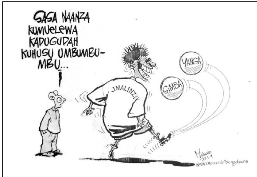
Bild 1: Ein Spieler kann sich nicht entscheiden, ob er für Yanga oder Simba spielen möchte, in: Majira , 24. Jan. 2004.

Da sowohl Cartoons als auch Fußball selbst populäre Ausdrucksformen sind, eignen sie sich besonders dazu, diesem anderen Blick nachzuspüren.