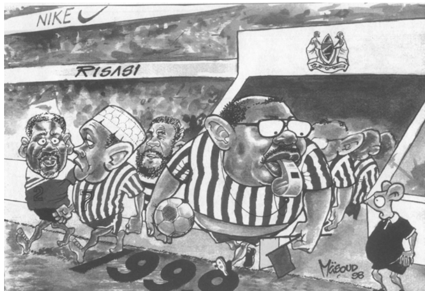
Bild 3: Wahlkampf als abgekartetes Spiel, in: Friedrich Ebert Stiftung 2001: 116.