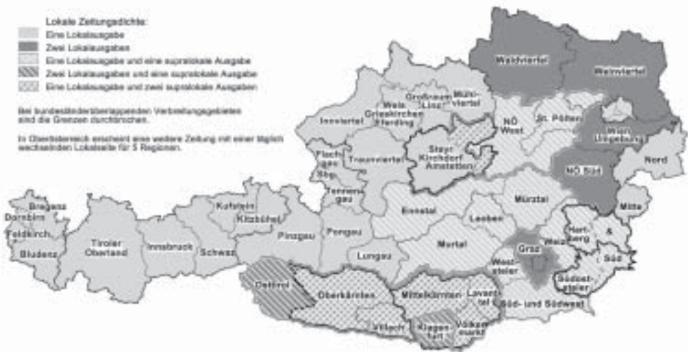
Abbildung 4: Lokale Zeitungsmärkte in Österreich 2005

Die für Wien eingezeichneten lokalen Märkte – sie beziehen sich auf die vier Wiener Lokalausgaben der „Kronen-Zeitung“ – sind für das Nutzungsverhalten weitgehend irrelevant.