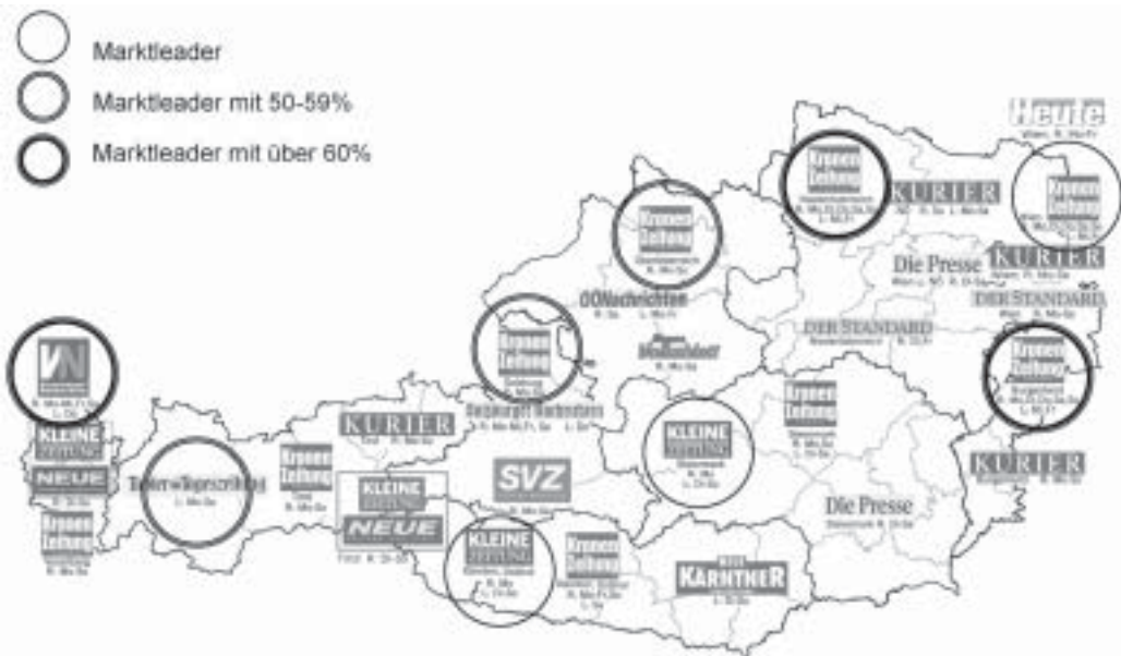
Abbildung 3: Regionale Zeitungsmärkte in Österreich 2005

L = Lokalausgabe(n), R = Regionalausgabe(n); die jeweils daneben stehenden Wochentage beziehen sich auf die Erscheinungstage.