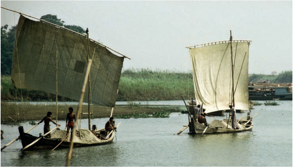
Abb. 22 Auf dem Irawadi in der Nähe von Mandalay sah der Autor 1988 eine Gruppe von Lastenseglern, die Sand transportierten. Sie besaßen ein Spitzgatt und wurden durch zwei Außenrunder gesteuert. Sie waren mit einer Mischung aus Setteesegel und Rahsegel ausgestattet.