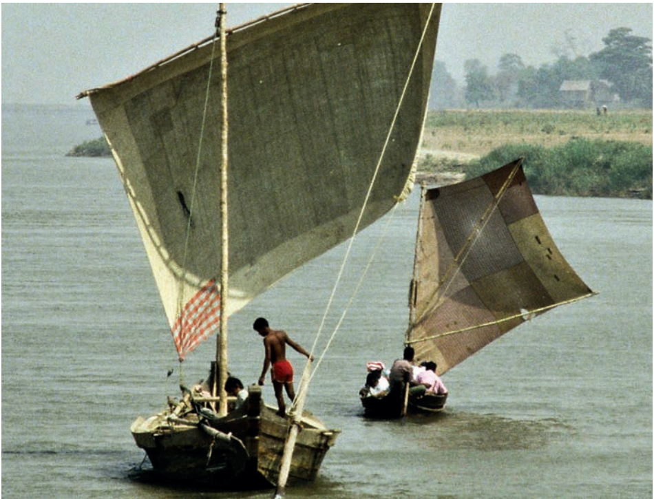
Abb. 23 Irawadi 1988. Bei einem kleineren dieser Boote ist auch ein klassisches Sprietsegel zu finden.