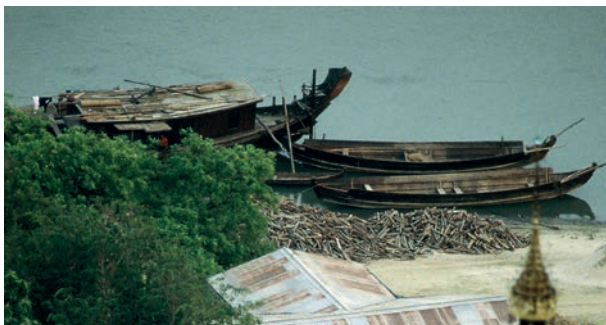
Abb. 13 Ein Blick auf das Ostufer des Irawadi. Das größere der Fahrzeuge ist zwar kein »Reisboot«, aber der erhöhte Sitz des Steuermanns im Heck erinnert stark an die Konstruktion dieser Flusstransporter, die bis zum Beginn des 20. Jahrhunderts in Betrieb waren. Das Foto wurde 1988 auf der Sagaing-Kette (bei Mandalay) vom Tempel Sun U Ponya Shin aus aufgenommen.