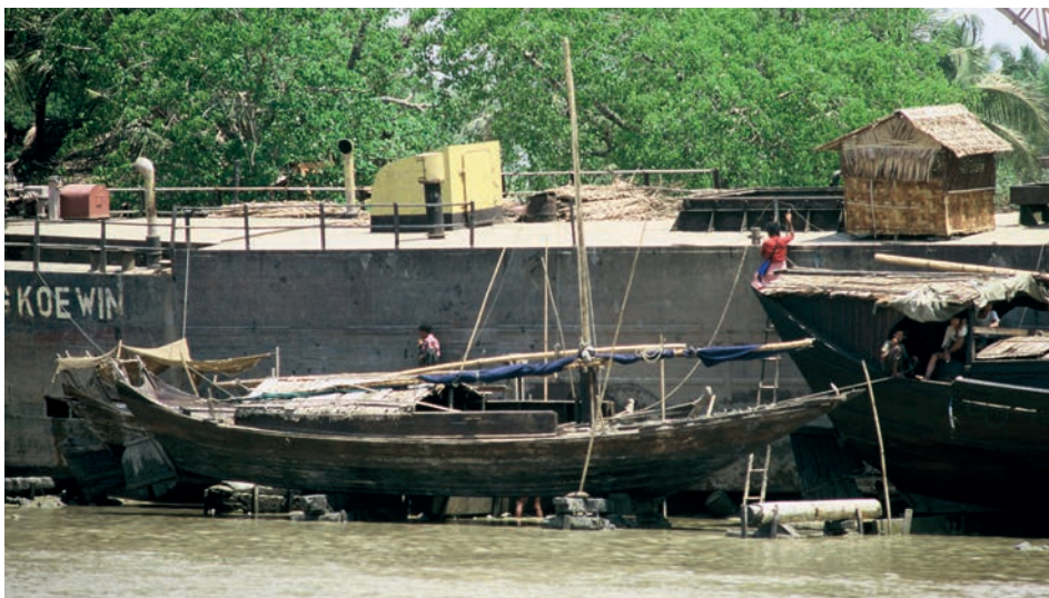
Abb. 19 Rangun 1988: Bei diesem mit dem Kiel auf Klötzen liegenden Fahrzeug lassen sich gut seine hinreißend scharfen Linien erkennen. Sie ähneln dem Typ der »bheddi«, wie er im Golf von Bengalen für den Fischfang zu finden war.