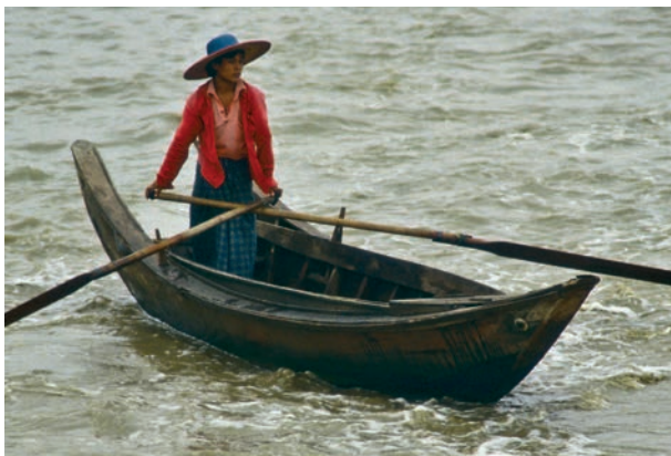
Abb. 14 Rangun 1988: Die kleinste Form des Samsans dient allein der Personenbeförderung.

Nutzen der Briten, nicht der Burmesen, außer Landes gebracht worden waren. Das hatte zu Arbeitslosigkeit geführt, zu wachsender Verarmung der Bauern und damit des ganzen Landes. 52