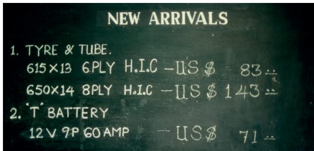
Abb. 25 Rangun 1988: In einem großen Kaufhaus im Zentrum der Stadt zeugten leere Regale vom Tiefpunkt der Wirtschaft des Landes. Es gab nichts zu kaufen – außer den »new arrivals«, die mit Dollars zu bezahlen waren.