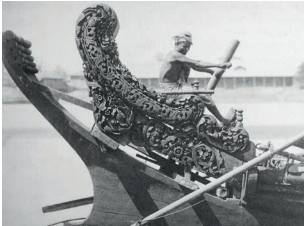
Abb. 11 Eine weitere Besonderheit der burmesischen Reisboote war der erhöhte, thronartige Sitz für den Steuermann. Er war oft mit reichem floralen Schnitzwerk verziert. (Aus: Abbas 2014)

beschützenden Gott, der im Bug des Schiffes verehrt wurde. Daher fanden sich die Oculi dort. 50 Wie der Autor 1988 beobachtete, waren auf manchen Booten zwar die entsprechenden Scheiben am Bug vorhanden, die Oculi waren aber geschwärzt.