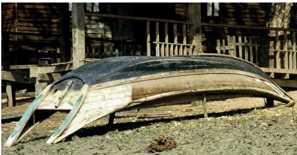
Abb. 15 Rangun 1988: Die kieloben liegenden Sampans an Land lassen ihre eleganten Linien erkennen.

Programm mit den Schlagworten: Nationalisierung, Industrialisierung und Verhinderung ausländischer Investitionen und Einflüsse vorgestellt. Doch der Staat war, auf sich allein gestellt, zu schwach, um das zu realisieren. Es fehlten Einkünfte und einheimische Fachleute. So wurde Burma isoliert und zu einem der am wenigsten entwickelten Länder der Welt. Es verschwand hinter dem »Bambusvorhang«. 53 Doch die »indische Reisfahrt« war nicht ganz verschwunden. 1967 erschien bei F.A. Brockhaus in Leipzig das Buch »Landgang in Madras und Rangun« von Martin Müller. Darin wird die Reise des 10 000-Tonnen-Stückgutfrachters FRIEDE mit dem Heimathafen Rostock ins Delta des Irawadi beschrieben. Die DDR leistete in Burma Entwicklungshilfe. Wie in alten Zeiten wurde die Reisladung mit Lastkähnen ans Schiff gebracht. Die Besatzung staunte über die zahlreichen altertümlichen Boote auf dem Fluss und über die Sampans mit den zwei »Hörnern« achtern, für die sie keine Erklärung hatte.