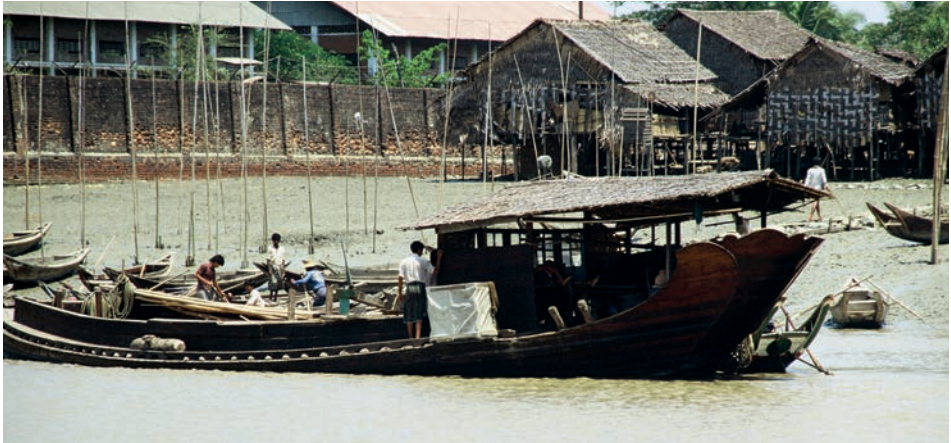
Abb. 21 Hafen von Rangun 1988: Ein tief beladenes Frachtschiff mit einem charakteristischen Achterschiff. Es besitzt Seitenruder, deren Dollen gut zu erkennen sind. Wahrscheinlich wurde es geschleppt. Die Gangway entlang des Dollbords dient aber auch zum Staken des Fahrzeuges.

den Ufern des Irawadi wurden allerdings nicht mehr, wie zu Rosenbergers Zeiten, von Elefanten bewegt, sondern von Büffeln gezogen.