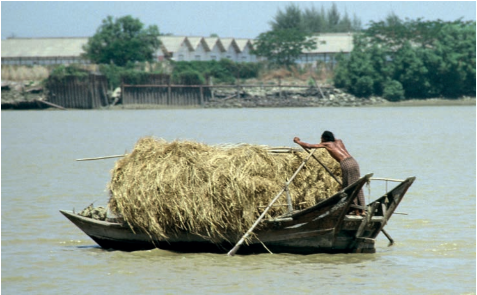
Abb. 16 Rangun 1988: Eine etwas größere Form des Sampans, der von einem Mann fortbewegt wird.