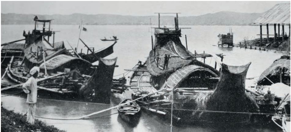
Abb. 10 Die burmesischen Reisboote, von Frau Rosenberger vielfach bewundert, bestachen durch ihre eleganten Linien. Die größten konnten bis zu 150 Tonnen Reis transportieren und hatten eine Besatzung von etwa 20 Mann. Auffallend war die Außengangway der decklosen Schiffe. (Aus: Hornell 1946)

Die meisten Boote im Irawadi-Delta trugen 1988 noch das archaische Zeichen der Oculi. Der Oculus war nicht nur bei den Booten im Golf von Bengalen zu finden, sondern weit darüber hinaus. Er geht auf einen magischen Brauch zurück, der sich einst vom alten Ägypten oder Mesopotamien in alle Himmelsrichtungen verbreitet hatte. 49 Schließlich gab es ihn von Westeuropa bis ins Chinesische Meer, wo der Oculus zu den typischen Merkmalen einer Dschunke gehörte. Nur in den muslimischen Ländern war der Oculus nicht bekannt. Schon die altägyptischen Begräbnisboote trugen ihn als Auge des Gottes Horus am Bug. In der Antike hatten die Römer den Brauch von den Griechen übernommen. Er beruhte auf der Vorstellung von einem