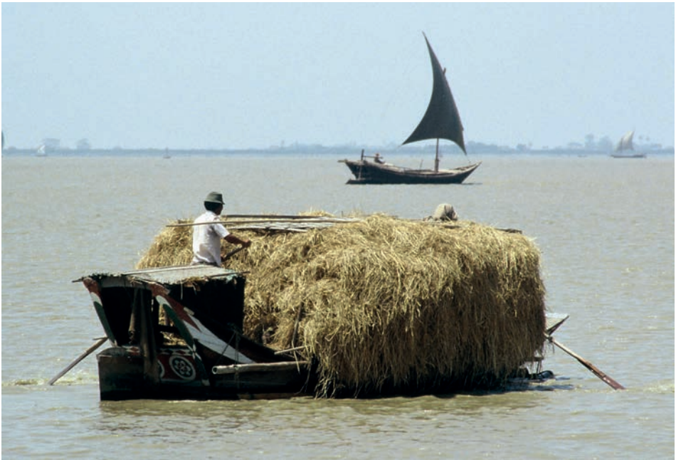
Abb. 17 Rangun 1988: Auch hier dienen Muskelkraft und Wind zur Fortbewegung der Wasserfahrzeuge.