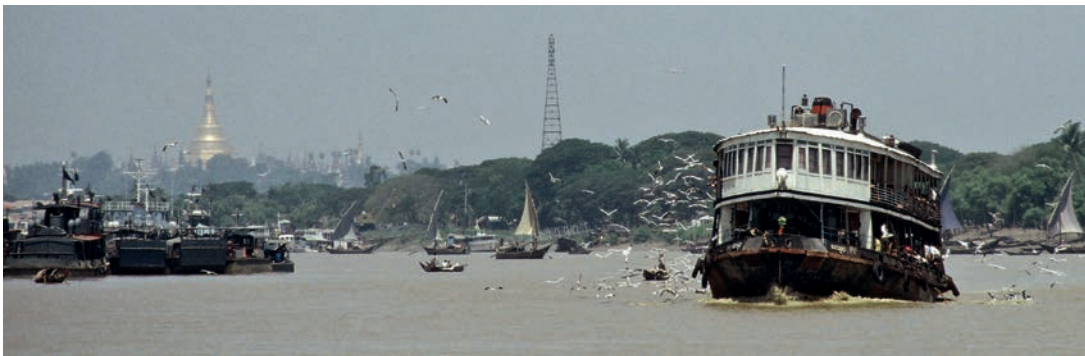
Abb. 1 Rangun 1988: Eine Fähre durchquert das Hafengebiet, in dem noch eine Vielzahl geruderter und gesegelter Sampans unterwegs ist. Im Hintergrund leuchtet, wie zur Zeit der Kapitänswfrau Rosenberger, die Spitze der Shwedagon-Pagode.

Die Fahrt auf der überfüllten Fähre dauerte etwa 45 Minuten. Das war genug Zeit für die Betreiber der fliegenden Teeküchen, für die Imbisshändler und Lotterielosverkäufer an Bord, um Geschäfte zu machen. Man sah Mönche, Bettler und einfache Menschen vom Lande neben westlich gekleideten Burmesen. Ganze Familien hatten es sich an Deck bequem gemacht, und die Frauen und Mädchen zeigten ihr typisch burmesisches Tanaka-Make-up. Auffallend war, dass die Gesichter der Menschen hier ernster, nicht so heiter