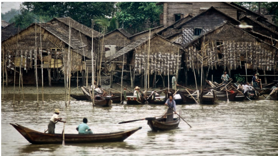
Abb. 6 Wegen der hohen Tide standen auch 1988 noch die mit gemusterten Matten bekleideten Hütten der Fischer und Bootsleute auf einem Wald von Pfählen.