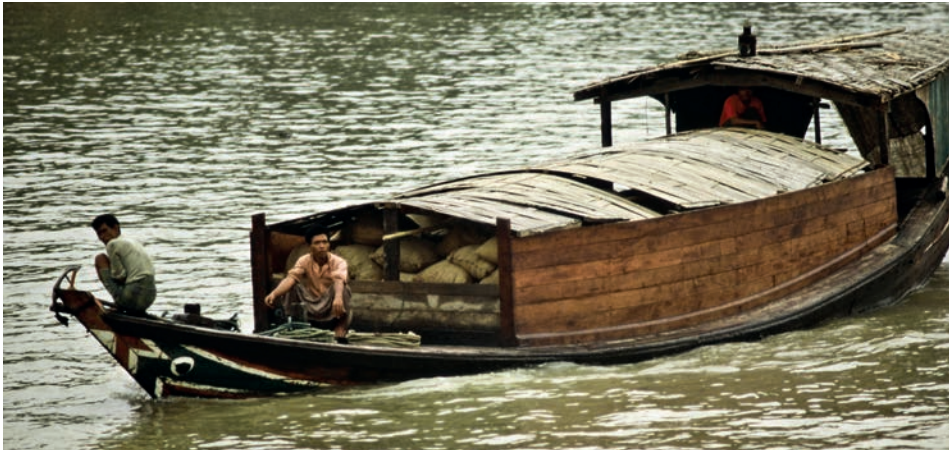
Abb. 24 Ein motorgetriebener Sampan mit einem Oculus, wie er 1988 bei vielen der Boote auf dem Irawadi gebräuchlich war.