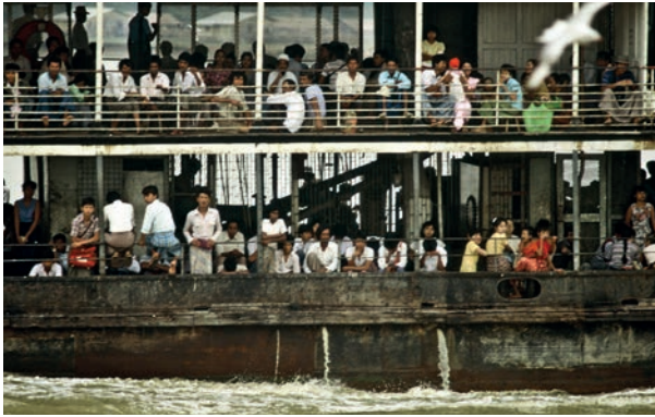
Abb. 2 Die mit einem Diesel betriebenen Dampfer im Hafen Ranguns sind auch 1988, ebenso wie zu Rosenbergers Zeiten, mit braunem Volk besetzt.

waren wie in den touristischen Zentren Ranguns.