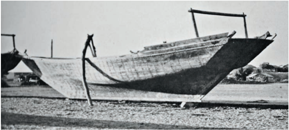
Abb. 20 Der Rumpf einer pakistanischen »bheddi« ähnelt stark einem Bootstyp, den der Autor 1988 im Bereich des Hafens von Rangun sehen konnte. (Aus: Greenhill 1971)