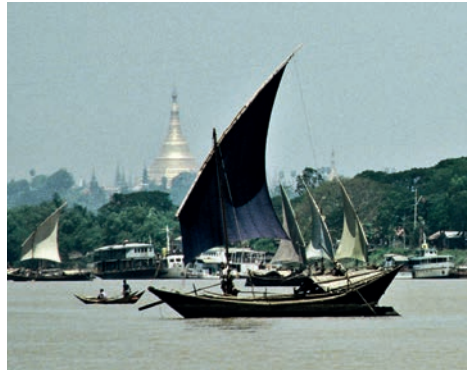
Abb. 3 Rangoon 1988: Wie gegen Ende des 19. Jahrhunderts dominieren neben dem Stupa der Shwedagon-Pagode im Hintergrund die Setteesegel der im Hafen kreuzenden Personen- und Frachtsampan das Bild.

Zwei Jahre später, im April 1895, kam die REGULUS wieder nach Birma.