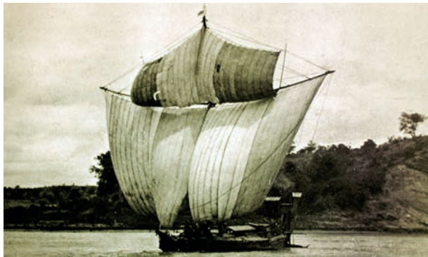
Abb. 12 Um flussaufwärts zu gelangen, besaßen die Reisboote einen Mast mit Rahsegel. Bei günstigem Wind konnten sie damit eine beeindruckende Segelfläche erzielen.

Die 1890er-Jahre, in denen das Ehepaar Rosenberger in das Delta des Irawadi kam, war die Zeit des ökonomischen Wachstums für Burma. Der Bedarf an burmesischem Reis stieg weiter und die Anbauflächen wurden vergrößert. Dichte Mangrovenwälder verschwanden. Die Hauptabnehmer für den Reis waren zu Rosenbergers Zeit die Europäer, allen voran die Deutschen. 51 Später wurde Indien der Hauptabnehmer.