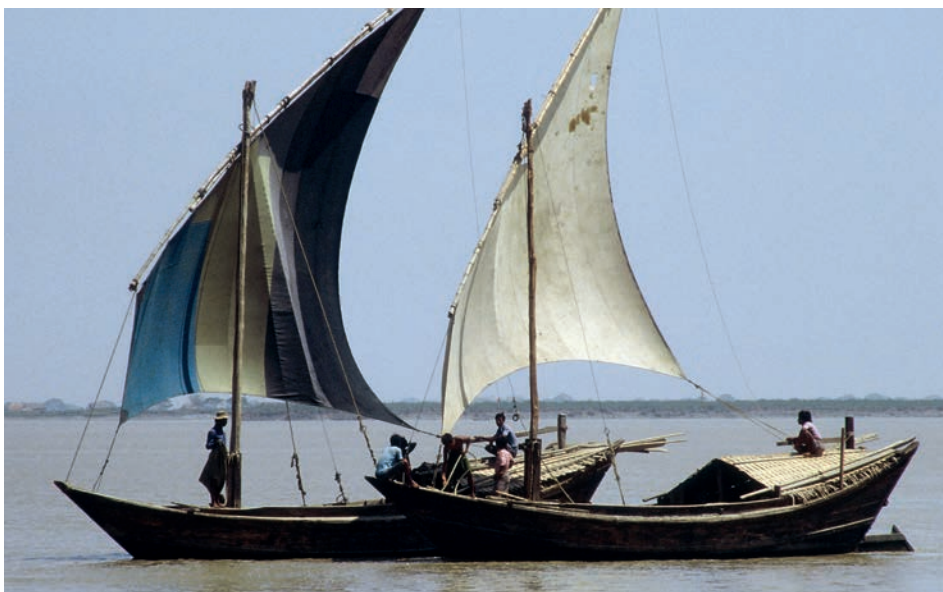
Abb. 18 Rangun 1988: Zwei mittelgroße Sampans mit einem trapezförmigen Setteeseegel mit kurzem Vorliek, wie sie im Hafengebiet Ranguns häufig zu sehen waren.