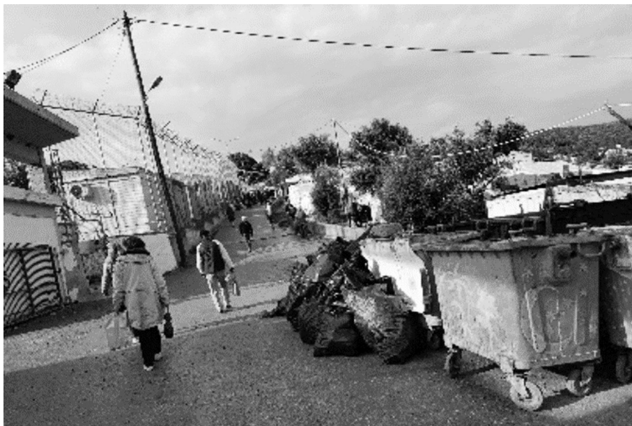
Fotografia 1*. Droga dzieląca obóz oficjalny (lewa strona) od obozu „nie-oficjalnego”, Moria, Lesbos, 28.11.2019 r.