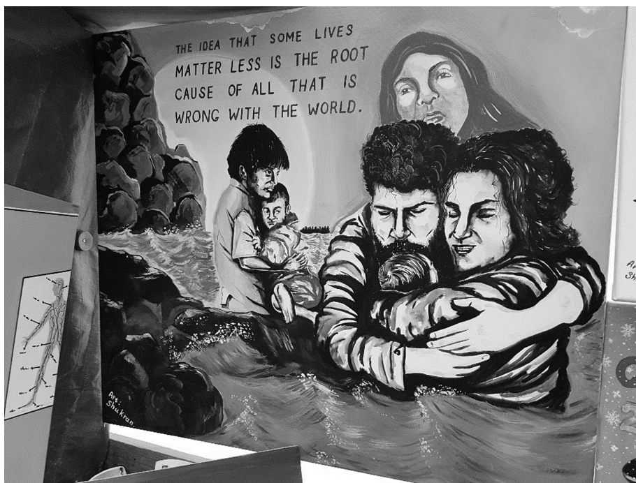
Fotografia 8. „Przekonanie, że życie niektórych ludzi ma mniejszą wartość, jest korzeniem wszelkiego zła na świecie”, Moria, Lesbos, 28.11.2019 r.

Rozmówcy dziennikarzy „The Guardian” przedstawiają warunki na Moria jako trudne do opisanego: „Często nie ma wody, nie ma elektryczności. Obawiamy się o życie naszych dzieci, że umrą z powodu deszczu, zimna i wiatru. Dla Syryjczyków jest to piekło. Jesteśmy bezdomni, nasze miasto, Idlib w Syrii, jest miejscem walki. Musieliśmy je opuścić, ale czasami uważamy, że Moria to tylko miejsce oczekiwania na śmierć. Życie w Morii jest niemożliwe – uwierz mi – większość z nas zmieniła się psychicznie. Niektórzy ludzie oszaleli” 22 .