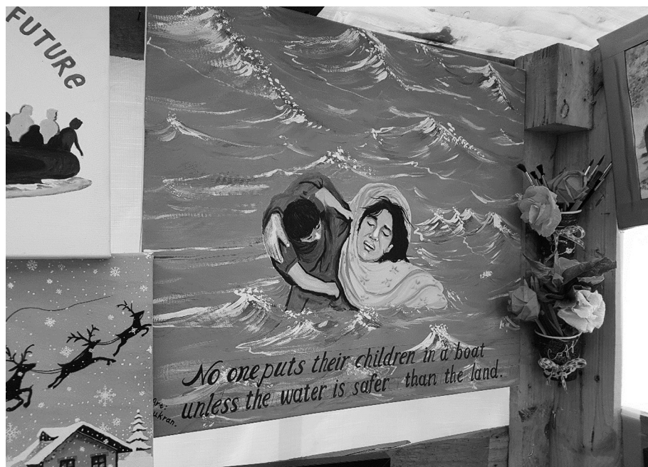
Fotografia 7. Obraz z „pracowni artystycznej”, Moria, Lesbos, 28.11.2019 r.