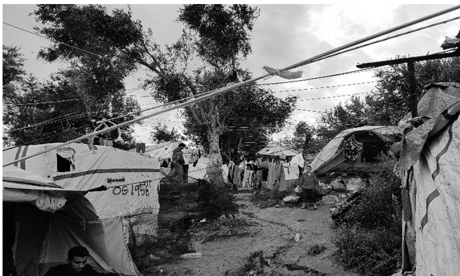
Fotografia 2. Typowy obraz z „obozu nieoficjalnego” – Moria, Lesbos, 28.11.2019 r.

Poniższe zdjęcia wykonane były półtora miesiąca wcześniej przed raportem cytowanych dziennikarzy. Oddają one tylko częściowo warunki, w jakich ludzie tam mieszkają czasem przez wiele miesięcy.