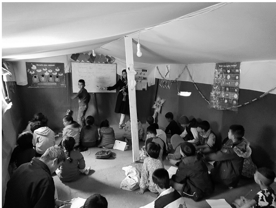
Fotografia 5. „Szkoła” – Moria, Lesbos, 28.11.2019 r.

W tym prymitywnym obozie można było stwierdzić oznaki pewnej zdolności do samoorganizacji, o czym świadczyć może poniższe zdjęcie rejestrujące prowadzenie zajęć lekcyjnych.