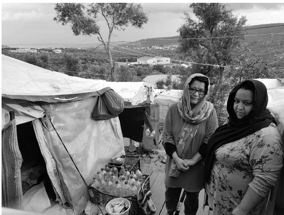
Fotografia 4. Dwie Afganki – Moria, Lesbos, 28.11.2019 r.