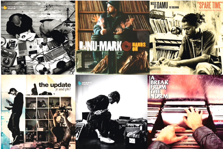
Abbildung 2: Typische Plattencover samplebasierter Popmusik

gen sie aber auch die symbolische Ordnung über die klanglich fixierte Musik von anderen Musiker_innen, die sie kontrollieren und über die sie verfügen. Sie bringen die Musik in eine gewünschte Reihenfolge und stellen ihre eigene individuelle oder kulturelle Identität damit an den Anfang. Typisch ist das Regal »Expedit« von IKEA, das sich aufgrund seiner Abmessungen hervorragend zur Aufbewahrung von 12" großen Schallplatten eignet und daher auch auf Plattencovern zu finden ist (siehe Abbildung 2). Besonders wertvolle oder begehrte Platten werden im Regal mit dem Cover hin zum Raum präsentiert und dadurch wie Jagdtrophäen hervorgehoben. Der eigene Konsum und der damit verbundene Geschmack werden auf diese Weise betont und ausgestellt. Das Sammeln ist dennoch keine Tätigkeit, die sich nur auf Tonträger wie Schallplatten, CDs oder MP3s beschränkt. Bei den von mir besuchten Produzent_innen konnte ich oft umfangreiche Sammlungen anderer Konsumgüter begutachten. Viele sammeln VHS-Kassetten und DVDs, Bücher, Comics und Zeitschriften, aber auch Partyflyer, Plakate mit dem eigenen Pseudonym und Backstagepässe.