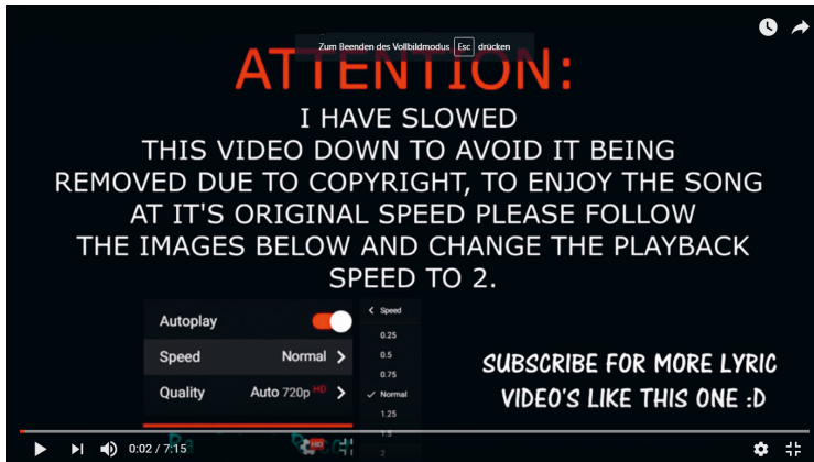
Abbildung 5: Youtube-Video mit urheberrechtlicher Umgehungsstrategie (Screenshot)

Produzent_innen berichteten mir in meiner Erhebung von diesem Problem, insofern sie selbst zu diesem Zeitpunkt GEMA-Mitglieder waren. Daneben sind es nicht lizenzierte Samples oder Stücke in DJ-Sets, die zur automatischen Sperrung von Uploads führen. DJs und Produzent_innen, aber auch Fans behelfen sich damit, indem sie die Musik modifizieren, kurze Pausen einbauen oder die Geschwindigkeit so verändern, dass die algorithmische Detektion versagt, wie bei diesem Youtube-Video: