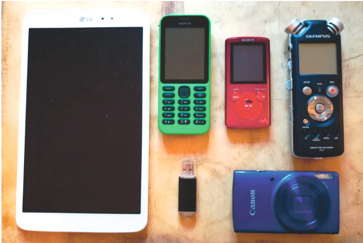
Abbildung 1: Untereinander nicht vernetzte Kopiertechniken; im Uhrzeigersinn links beginnend: Tablet, Handy, MP3-Player, Audiorekorder, Digitalkamera, USB-Stick

zu bleiben – dumb : ein simples Billigtelefon, mit dem es nicht mehr möglich war, Fotos aufzunehmen, Musik abzuspielen oder WhatsApp -Nachrichten zu schreiben. Lediglich Funktionen wie SMS und Anrufe waren technisch durchführbar, wenn auch in rudimentärer Form (beispielsweise konnte ich nicht mehr als zehn SMS speichern). Nach einer Umgewöhnungsphase von wenigen Wochen gefiel mir der digital detox , wie es ein Freund bezeichnete, da ich nicht mehr mobil ins Internet gehen und andere Aktivitäten an meinem Telefon machen konnte, die mich, wie ich nun erkannte, eigentlich mehr gestresst als mir genützt hatten. Ich beschloss, mir kein neues Smartphone zu kaufen, sondern das einfache Handy zu behalten.