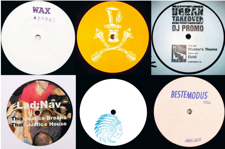
Abbildung 6: White Label-Releases

Samples enthalten, referenzieren dies ein- bis uneindeutig im Titel 64 (beispielsweise »Rinsing Quince«, das ein Stück von Quincy Jones sampelt); und DJ Vandal veröffentlichte einen Remix unter seinem Alias Lad:Nav (siehe Abbildung 6).