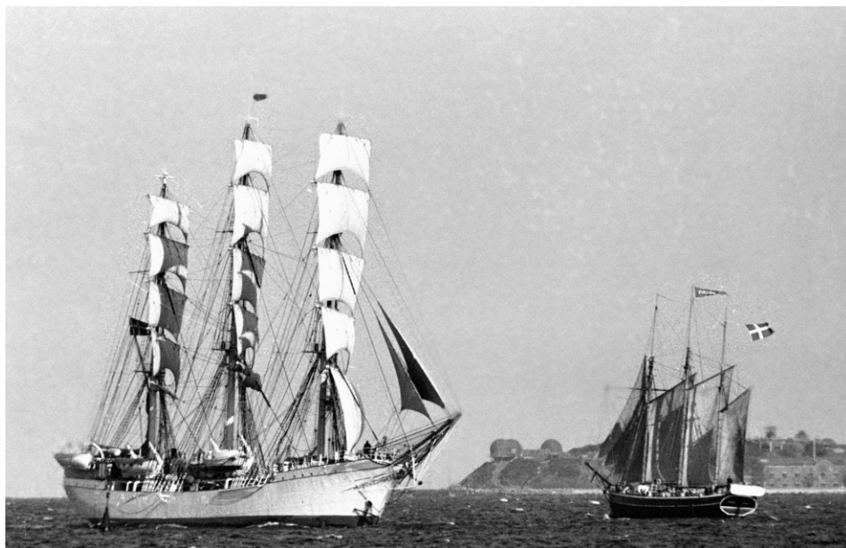
Abb. 10 FULTON dippt vor dem Schulschiff DANMARK die Flagge, 1970.

Deshalb kam das Projekt schnell in Schwierigkeiten, die damit zusammenhingen, daß man nicht den gängigen Vorgehensweisen gefolgt war. Da die Fahrten des ersten Jahres unter der