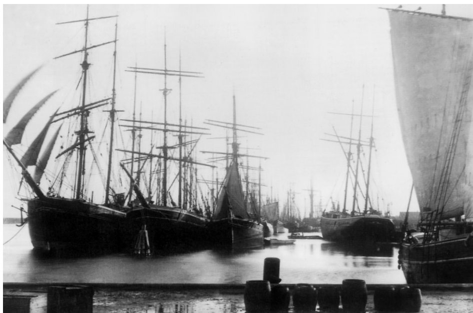
Abb. 1 Der Hafen von Marstal mit über Winter aufgelegten Schiffen um 1910.

sein. Eine Kombination von tüchtigen Schiffbauern und Seeleuten, einer Risikoverteilung durch Aufteilung der Eignerschaft an jedem Schiff auf viele lokale Parten, einem örtlichen Versicherungsverein mit guter Kenntnis der Qualifikationen der Schiffer im Verein mit der legendären Sparsamkeit und Knickrigkeit der Marstaler Schiffer in Hinsicht auf z.B. die Ausgaben für Proviant waren wichtige Voraussetzungen für die damalige Schifffahrtswirtschaft in Marstal. 1