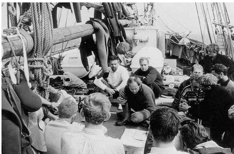
Abb. 8 Diskussion auf dem Achterdeck während der Taucherfahrt der FULTON, 1971.