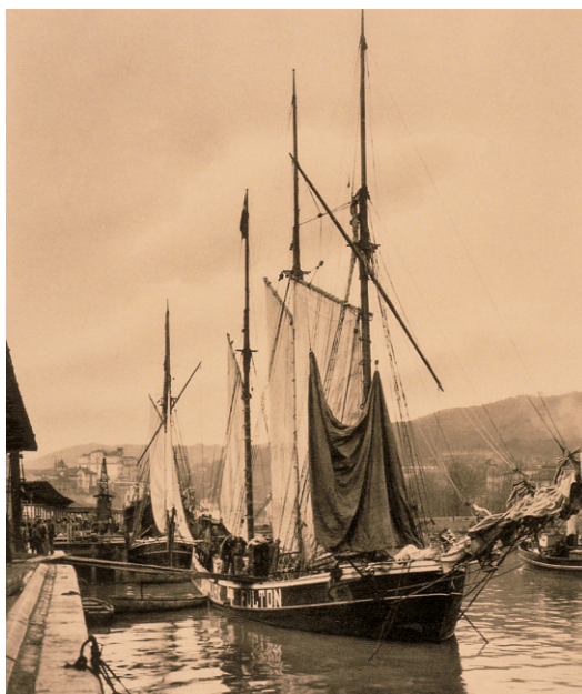
Abb. 6 FULTON im Hafen von Bilbao, 1916.