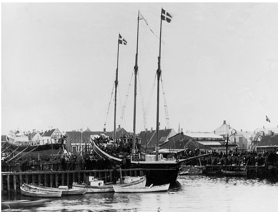
Abb. 4 Die FULTON beim Stapellauf am 26. März 1915. Das Schiff blieb auf dem Helgen stecken und mußte das letzte Stück unter großen Mühen gezogen werden.

tersegeln, im Gegensatz zu vier anderen Marstalschonern, die im Sommer 1915 auf derselben Fahrt angehalten und in Brand gesteckt wurden.