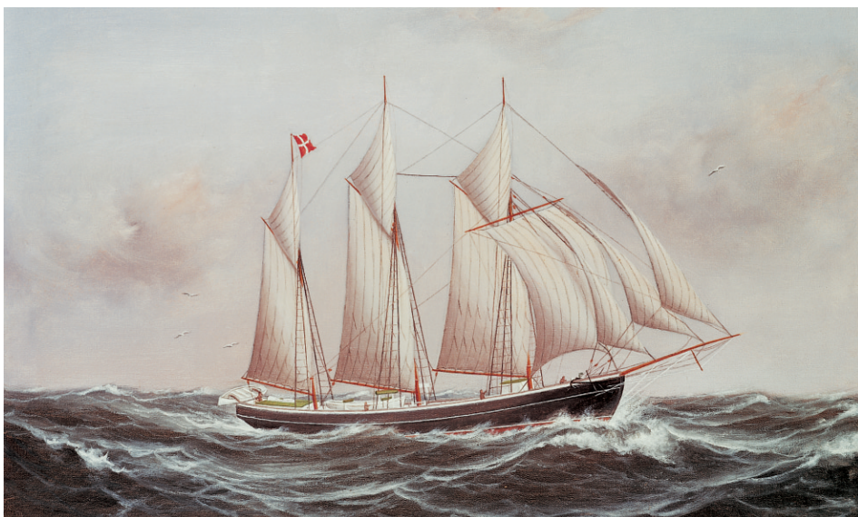
Abb. 3 Während die FULTON noch im Bau war, bestellte Kapitän Eriksen bei dem örtlichen Schiffsporträtmaler H.A. Hansen, der selbst zur See gefahren war und sich leicht vorstellen konnte, wie der Schoner sich auf den Wogen des Atlantiks ausnehmen würde, ein großes Ölgemälde des Schiffes. Hier präsentiert sich die FULTON unter vollen Segeln bei frischem Wind, so wie der stolze Eigner sein Schiff am liebsten sehen würde. (Privatbesitz)

schen Hasardspiel geprägt, das den jäh steigenden Frachtraten im Kielwasser folgte. Es gab gewaltige Preissteigerungen und eine völlig schiefe soziale Entwicklung.