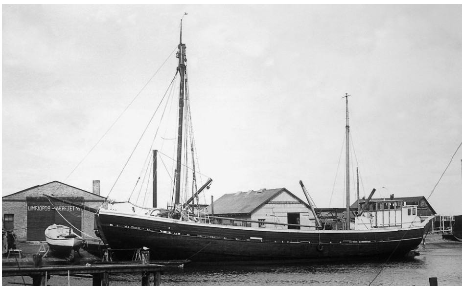
Abb. 7 MS FULTON von Ålborg verläßt vollbeladen den Hafen, 1960er Jahre.

ber 1969 gekommen, nachdem es auf seiner letzten Reise als Frachtschiff 159 Tonnen Weizen von Nakskov nach Århus gebracht hatte. Zwei Monate später lag das Schiff für die Bodenbesichtigung im Dock, danach fand die Übernahme statt. Die FULTON hatte nur noch einen der ursprünglichen Masten, achtern war ein großes Steuerhaus errichtet worden, und nahezu das gesamte Deck wurde von den großen Luken eingenommen, so daß vom Segelschiffscharakter nur wenig übrig geblieben war (Abb. 7); doch der Rumpf war überall dort, wo man die Spanten untersuchen konnte, gesund und gut.