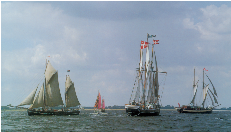
Abb. 11 FULTON und BONAVIDA während der jährlichen Fahrt alter Schiffe rund Fünen.