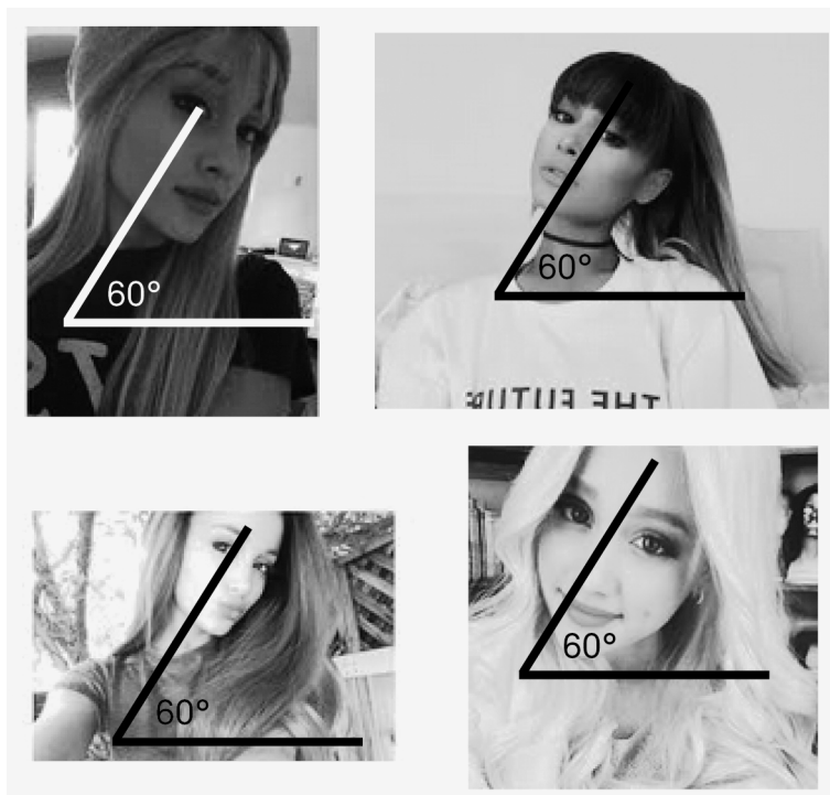
Abbildung 10: Beispielbilder vom Instagram-Profil von Ariana Grande (mit Winkel)

Quelle: arianagrande. https://www.instagram.com/arianagrande/?hl=de (Zugriff: 01. Februar 2017).