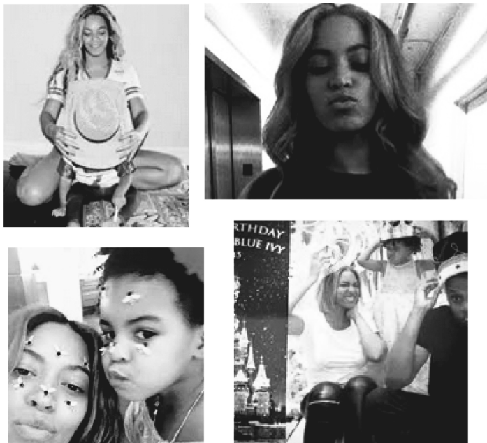
Abbildung 11: Beispielbilder vom Instagram-Profil von Beyoncé Knowles

Quelle: beyonce. https://www.instagram.com/beyonce/?hl=de (Zugriff: 01. Februar 2017).