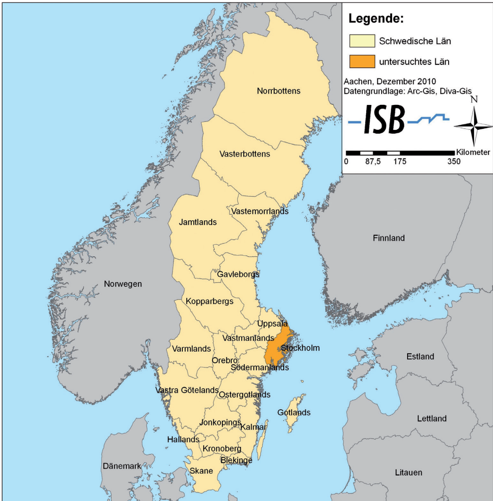
Abb. 1: Schwedische Regionen (Län)