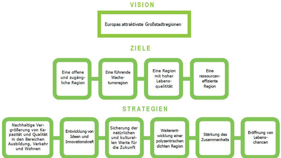
Abb. 4: Strategischer Ansatz des RUFs 2010 (Planungsvision – Ziele – Strategien) 1